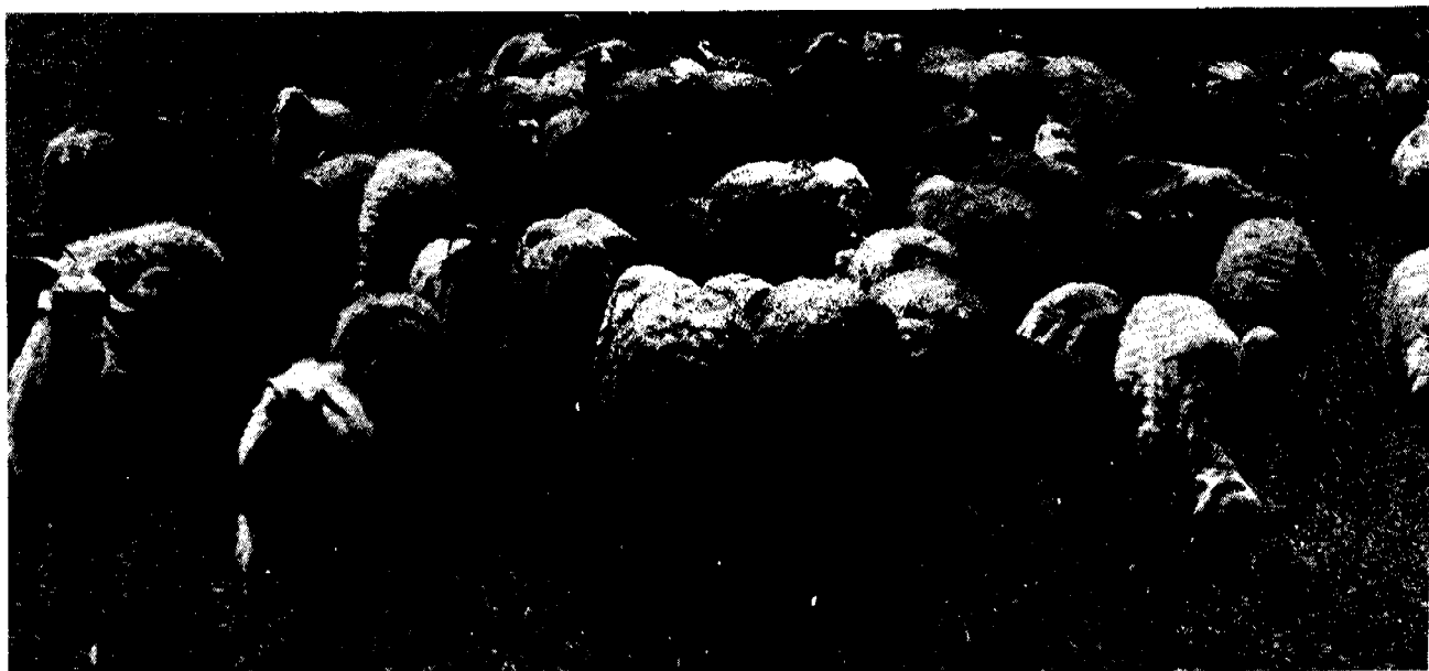
جدول ۵: متوسط میزان تولیدات لبنی - به هزار تن