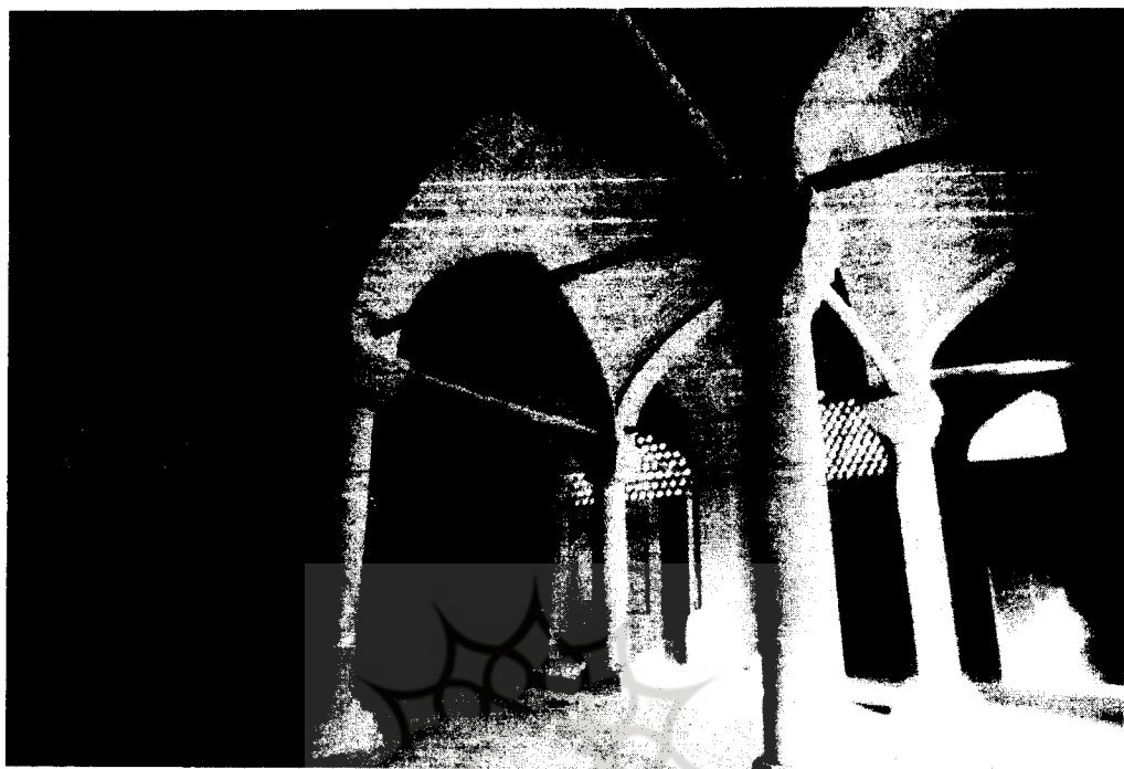
اصفهان مسجد سید، قاجاریه

گرفته‌اند. مسلمانان ایران نیز شکل استوانه را از هند، و مسلمانان آفریقا طرح مناره چهارگوش را از چراغ دریایی معروف اسکندریه اقتباس کردند. می‌توان گفت برج‌های چهارگوش که معبد قدیم دمشق بر آن استوار شده بود در شکل‌گیری مناره اسلامی بی‌تأثیر نبوده است.