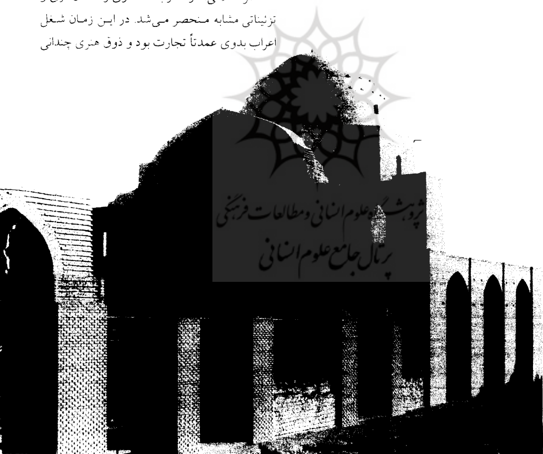
درآیین: مسجد جامع، نمای خارجی، ۷۰۳ هـ. ق.

هنر اسلامی، در آغاز به معماری و سفال‌کاری و تزییناتی مشابه منحصر می‌شد. در این زمان شغل اعراب بدوی عمدتاً تجارت بود و ذوق هنری چندانی