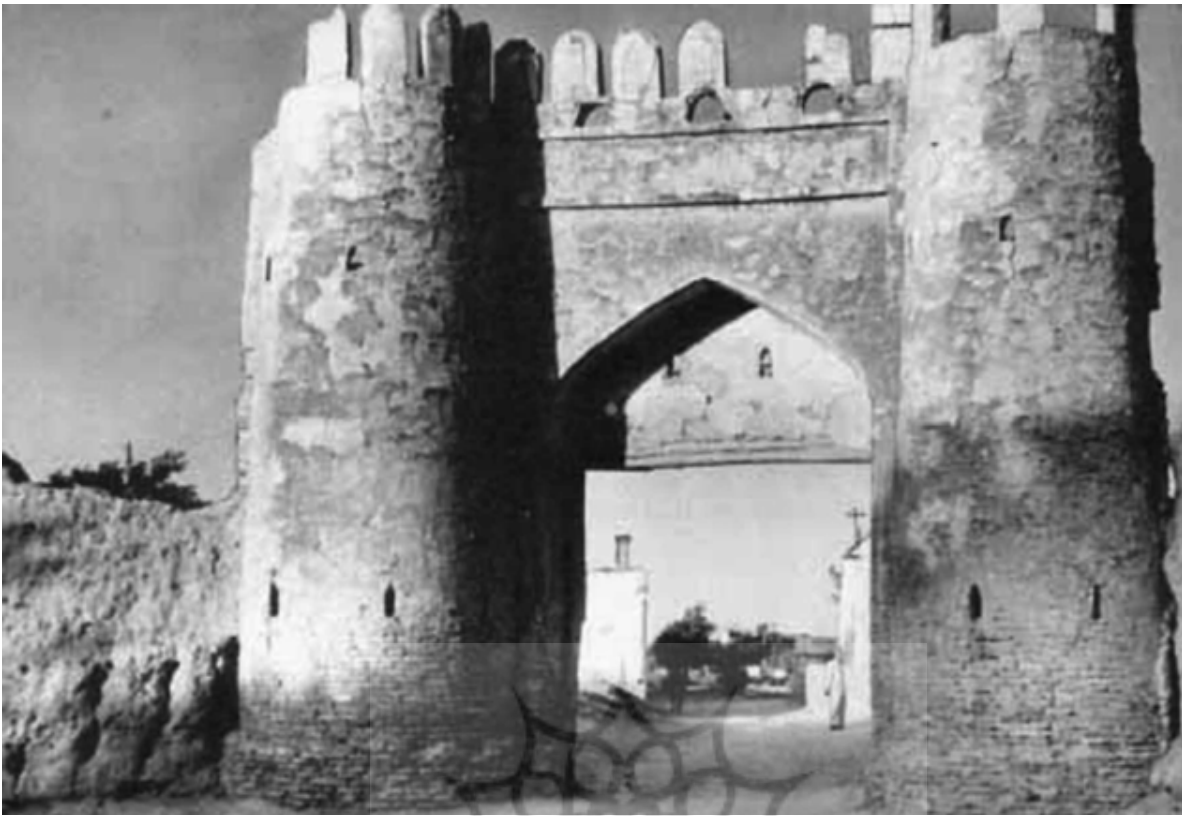
دروازه باستانی شهر بخارا

کشتی‌ای ساز تا بر آن گذری گو سپندیم و جهان هست به کردارِ نعل چون گه خواب بود سوی نعل باید شد در اغلب این ابیات نگاه او به دنیا حکیمانه و اندوهگنانه است و آدمی را از دل بستن به دنیا بر حذر داشته است. در شعر رودکی نیز مانند خود زندگی اندوه و شادی هر دو در کنارهمند و او اندوه زندگی را همراه با شادی و غم عشق شناخته و تصویر کرده است: دلخیزانۀ پر گنج و گنج سخن نشانِ نامهٔ ما مهر و شعر عنوان بود همیشه شاد و ندانستمی که غم چه بود دلخیزانۀ نشاط و طرب را فراخ میدان بود ز آغاز به بوسه‌ها مهربان کرد دلخیزان امروز نشانۀ غمان کرد دلخیزان او به هنگام وصف یار، چهرهٔ او را به برگ یاسمین، لاله، لعل، شمع، روز، دریای حسن، ماه، ماه تمام، دیبا، گل پری، بت و جز آن مانند می‌کند: