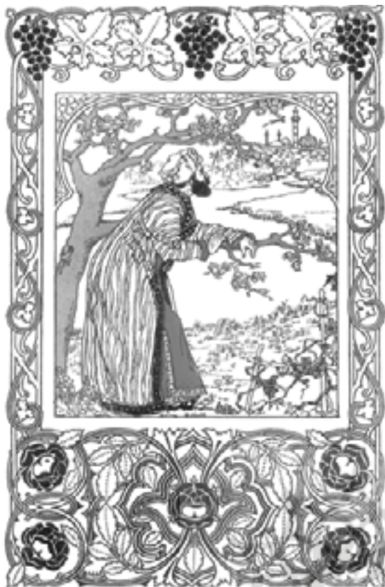
تصویرگران، ناشرین و آثار آنان.»

البته نویسندگان کتاب تنها به بررسی وضعیت نقاشی‌های رباعیات نمی‌پردازند بلکه علاوه بر آن به شخصیت خیام و فیتزجرالد و دوستانی که او را در این کار کمک کرده‌اند نیز توجه دارند: «داستان ما از رباعیات فیتزجرالد، تنها در مورد کتاب‌ها و تصاویر نیست، بلکه مربوط به افراد هم می‌شود. دو بازیگر اصلی، یعنی عمر خیام و ادوارد فیتزجرالد وجود دارند، و هنرپیشگان دیگر شامل دوستان فیتزجرالد، به خصوص ادوارد کاول، که نقش بسیار مهمی در خلق رباعیات داشت. علاوه بر آن از سال ۱۸۵۹ بازیگران بسیار دیگری نیز وجود داشته‌اند. این افراد شامل محققان و مترجمان برجسته ادبیات فارسی، مانند هرون - آلن، بستن، آربری، اوری، هدایت، فروغی و دشتی بودند و فهرست کنندگان رباعیات مانند پاتر، به اضافه شخصیت‌های مهم در بنگاه‌های کوچک و بزرگ انتشاراتی، و تصویرگرانی که آنان به کار گرفتند. همگی این افراد به صورت‌های مختلف در پدیده خارق‌العاده رباعیات فیتزجرالد دخالت داشتند. همچنان که مسیر این رویداد را دنبال کرده‌ایم، موفق به آشنایی با این اشخاص از طریق آثارشان گردیدیم. علاقه مشترک ما موجب شده که همگی آنان مانند دوستانمان به نظر آیند و امیدواریم که دیگران نیز از آشنایی با آنان لذت ببرند.