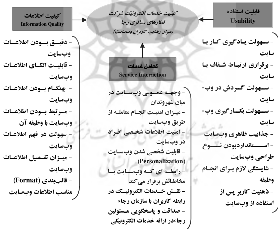
نمودار ۲. مدل مفهومی پژوهش [۳]

پس از بررسی ادبیات کیفیت خدمات عمومی الکترونیک، مدل «ای کوال» جهت این پژوهش انتخاب شد. این مدل دارای سه بُعد است که همراه با متغیر وابسته پژوهش یعنی «رضایت کاربران وبسایت»، مدل مفهومی پژوهش را شکل می‌دهند.