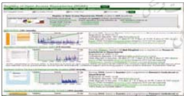
شکل ۱. نمایشی از صفحه خانگی آر. او. ای. آر

سپردن گاه (آرشیو یا واسپارگاه) مکانی است برای ذخیره و نگهداری آثار علمی (کتاب، مقاله مجله، مقاله کنفرانس، گزارش‌های علمی و فنی، پایان‌نامه و پیش‌نویس مقاله‌ها پیش از انتشار) در یک حوزه علمی خاص در سطح ملی یا بین‌المللی. قابل توجه است که پژوهشگران می‌توانند به راحتی نسخه‌ای از آثار علمی خود را در یک واسپارگاه ذخیره کرده و جامعه کاربر به سهولت به آثار واسپاری شده دسترسی پیدا کند و با رعایت حق معنوی مؤلف (یعنی با حفظ نام نویسنده مسئول، استنادکردن و عدم سرقت ادبی) از آثار واسپاری شده استفاده کند. بدیهی است شناسایی و معرفی طرح‌هایی که مبادرت به جمع‌آوری سپردن گاه‌های دسترسی آزاد در سطح بین‌المللی می‌کنند، حائز اهمیت است و به همین منظور در زیر به معرفی فهرست ثبت سپردن گاه‌های دسترسی آزاد می‌پردازیم.