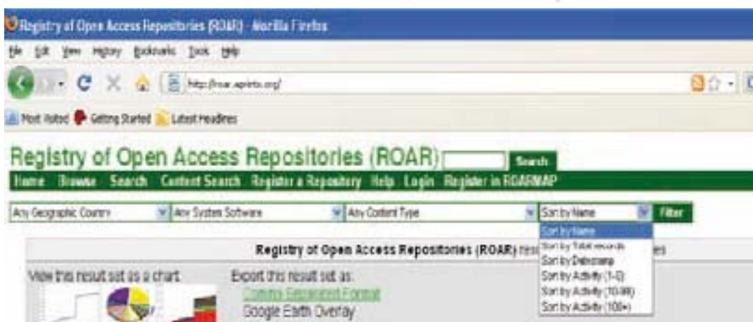
شکل ۷. محدود کردن دامنه جستجو براساس نام و کل رکوردها

گزینه شماره ۴. Total Records، نمودار مربوط به رکوردهای موجود در تمام سپردن گاهها را برای کاربر به نمایش می گذارد. گزینه شماره ۵. Document Formats، پروفایل فرمت فایل ۱۳ (پروفایل کدگذاری اطلاعات به منظور ذخیره سازی در فایل کامپیوتر) را برای تمام سپردن گاههای موجود ایجاد می کند. گزینه شماره ۶. Tab-Separated Format، کل رکوردهای سپردن گاههای موجود را به فرمت سی.اس.وی ۱۴ صادر می کند این قابلیت برای صدور دادهها در اکسل ۱۵ مفید است. گزینه شماره ۷. همان گونه که مشاهده می شود، در هر جستجو به دنبال نام سپردن گاهها، تعداد کل رکوردهای منطبق بر ابر داده دابلین ۱۶ موجود در آنها نشان داده می شود. گزینه شماره ۸. برای هر سپردن گاه، اطلاعاتی از قبیل نوع سیستم نرم افزاری مورد استفاده، موقعیت جغرافیایی، نوع محتوای موجود در آنها، تاریخ ثبت آن و میزان پوشش مدارک متن کامل ارائه می شود. گزینه شماره ۹. همان گونه که در این تصور مشاهده می شود، در برخی از موارد توصیفی از سپردن گاهها (پوشش موضوعی آنها) در ذیل آنها ذکر می شود. گزینه شماره ۱۰. نشان دهنده صفحه خانگی سپردن گاههاست که از طریق آن می توان با صفحه اصلی آنها ارتباط برقرار کرد. گزینه شماره ۱۱. نیز نمایانگر تعداد رکوردهای واسپاری شده در سپردن گاهها از زمان ثبت آنها به صورت روزانه است (نمودار دستاوردها).