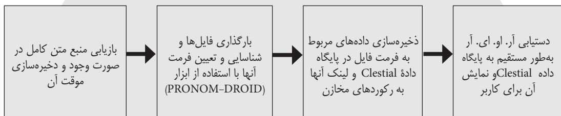
شکل ۸. روند شناسایی و درو کردن فایل‌ها در آر. او. ای. آر

رایگان رکوردهای موجود با استفاده از قابلیت‌های منطق بولی از مهم‌ترین ویژگی‌های این پروژه به‌شمار می‌آیند.