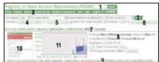
شکل ۳. قابلیت‌های ارائه‌شده توسط آر. او. ای. آر به کاربران

در این قسمت با توجه به شکل ۳ به برخی از قابلیت‌های آر. او. ای. آر اشاره می‌کنیم. ۱۱