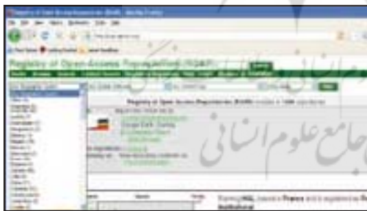
شکل ۴. محدود کردن دامنه جست‌وجو براساس موقعیت جغرافیایی سپردن‌گاه‌ها

گزینه شماره ۳. برچسب فیلتر برای محدود کردن دامنه جست‌وجو و انجام جست‌وجوهای چندگانه مورد استفاده قرار می‌گیرد. بدین ترتیب می‌توان جست‌وجو را براساس نام کشور (موقعیت جغرافیایی سپردن‌گاه‌ها)، سیستم نرم‌افزاری مورد استفاده در هر یک از سپردن‌گاه‌ها، نوع محتوای موجود در هر یک از سپردن‌گاه‌ها (آرشیو پایگاه اطلاعاتی خدمات نمایه‌سازی و چکیده‌نویسی، انتشارات، مجلات و پایان‌نامه‌های الکترونیکی، پژوهش‌های دانشگاه‌ها، مؤسسات پژوهشی و گروه‌های آموزشی)، نام سپردن‌گاه‌ها، تعداد کل رکوردها، و نمودار مربوط به دستاوردها محدود کرد (شکل‌های ۴ تا ۷).