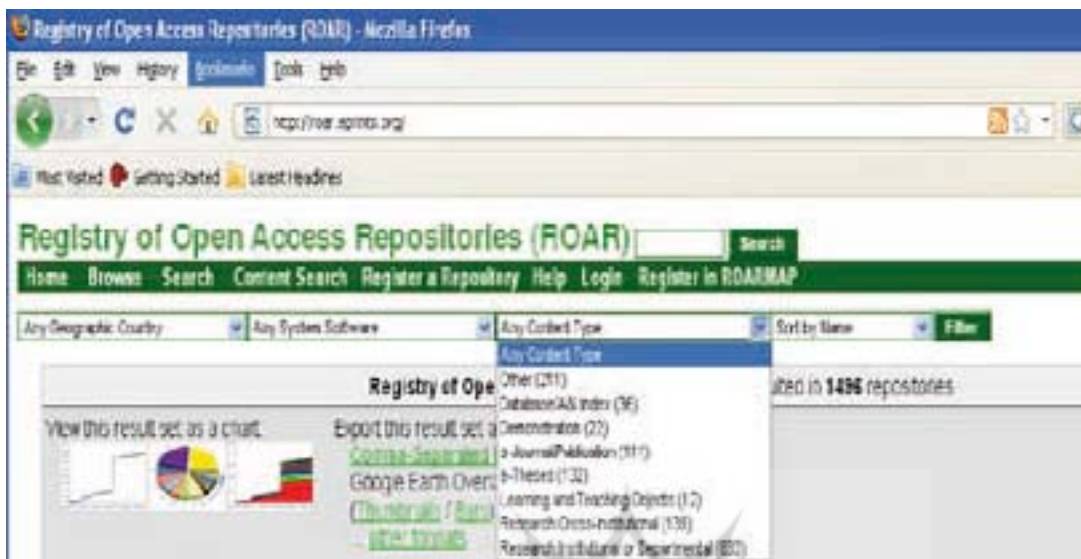
شکل ۶. محدود کردن دامنه جستجو براساس نوع محتوا

گزینه شماره ۴. Total Records، نمودار مربوط به رکوردهای موجود در تمام سپردن گاهها را برای کاربر به نمایش می گذارد. گزینه شماره ۵. Document Formats، پروفایل فرمت فایل ۱۳ (پروفایل کدگذاری اطلاعات به منظور ذخیره سازی در فایل کامپیوتر) را برای تمام سپردن گاههای موجود ایجاد می کند. گزینه شماره ۶. Tab-Separated Format، کل رکوردهای سپردن گاههای موجود را به فرمت سی.اس.وی ۱۴ صادر می کند این قابلیت برای صدور دادهها در اکسل ۱۵ مفید است. گزینه شماره ۷. همان گونه که مشاهده می شود، در هر جستجو به دنبال نام سپردن گاهها، تعداد کل رکوردهای منطبق بر ابر داده دابلین ۱۶ موجود در آنها نشان داده می شود. گزینه شماره ۸. برای هر سپردن گاه، اطلاعاتی از قبیل نوع سیستم نرم افزاری مورد استفاده، موقعیت جغرافیایی، نوع محتوای موجود در آنها، تاریخ ثبت آن و میزان پوشش مدارک متن کامل ارائه می شود. گزینه شماره ۹. همان گونه که در این تصور مشاهده می شود، در برخی از موارد توصیفی از سپردن گاهها (پوشش موضوعی آنها) در ذیل آنها ذکر می شود. گزینه شماره ۱۰. نشان دهنده صفحه خانگی سپردن گاههاست که از طریق آن می توان با صفحه اصلی آنها ارتباط برقرار کرد. گزینه شماره ۱۱. نیز نمایانگر تعداد رکوردهای واسپاری شده در سپردن گاهها از زمان ثبت آنها به صورت روزانه است (نمودار دستاوردها).