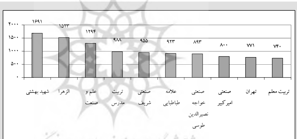
نمودار (۱) توزیع فراوانی تعداد اعضای جاری در ۱۰ دانشگاه اول تا تاریخ ۸۶/۱۱/۳۰

براساس این طرح ۲۳۴ کتابخانه وابسته به ۶۶ دانشگاه و مؤسسه پژوهشی در وزارت علوم، تحقیقات و فناوری به صورت داوطلبانه منابع خود را مستقیماً در اختیار اعضا قرار می‌دهند. این کتابخانه‌ها، در مجموع دارای حدود ۷ میلیون جلد کتاب، بیش از ۶۱ هزار عنوان نشریه ادواری جاری، و بیش از ۱۹۱ هزار عنوان پایان‌نامه و رساله (تکراری و غیر