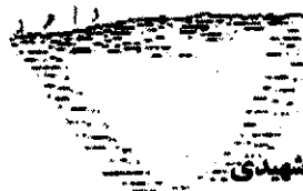
کاری از: داود شهیدی