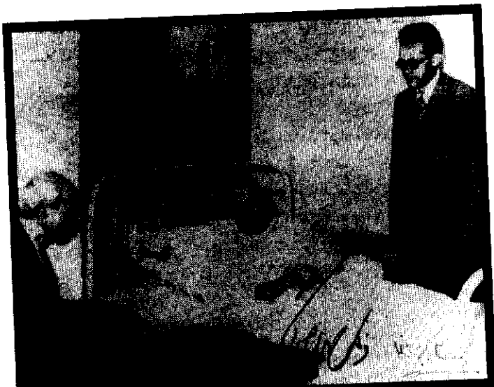
دهخدا، دکتر مصدق و نصرت‌الله امینی (شهردار زمان مصدق) امضای دهخدا در کنار امضای دکتر مصدق دیده می‌شود.

با آن که آقای همایون کاتوزیان نوشته است: «ایجاد شورای سلطنتی در غیاب شاه به ریاست علی‌اکبر دهخدا، لغت‌شناس و فرهنگ‌نویس معروف، مورد بحث قرار گرفت، اما پیگیری نشد»، اما واقعیت این بود که هماهنگی دهخدا با نهضت مردم ایران در آن روزهای سخت‌گذر تاریخی، امیدهای فراوانی به‌وجود آورد و از گوشه و کنار شهر شنیده می‌شد که: دکتر مصدق در مقام پست اجرایی نخست‌وزیری باقی خواهد ماند و استاد علی‌اکبر دهخدا رئیس‌جمهور ایران خواهد شد و در همانندی حکومت، ایران را با هند مقایسه می‌کردند.