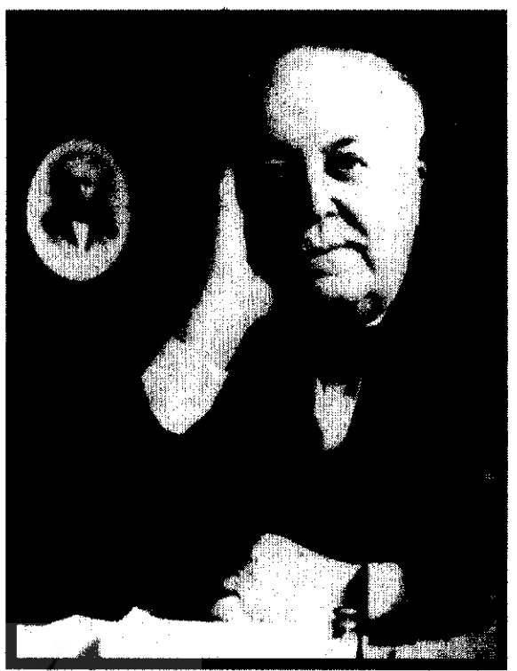
پروفسور هانری رولن، وکیل ایران در دادگاه بین المللی لاهه