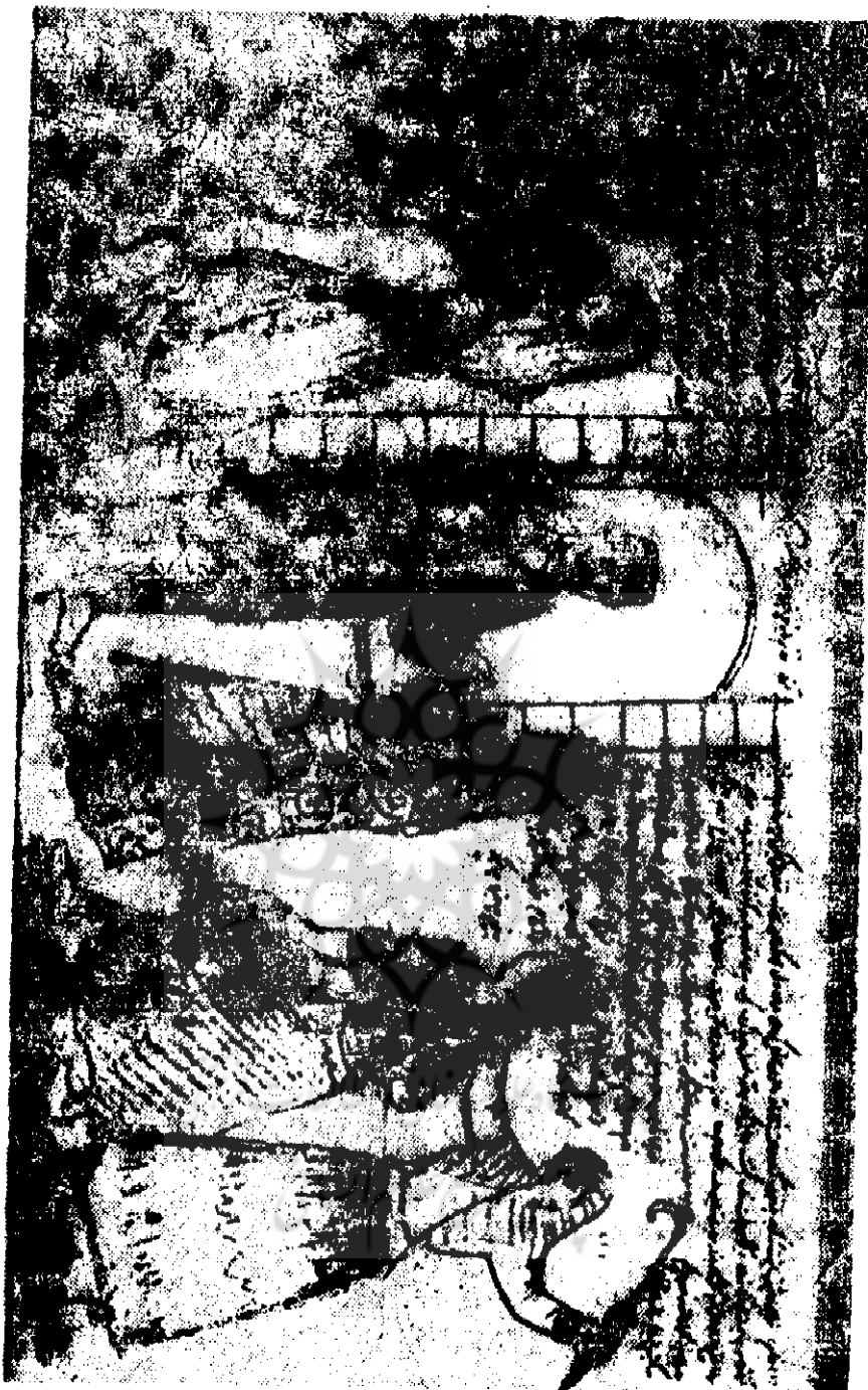
تصویر یکی از کاریکاتورهای روزنامه شکوفه