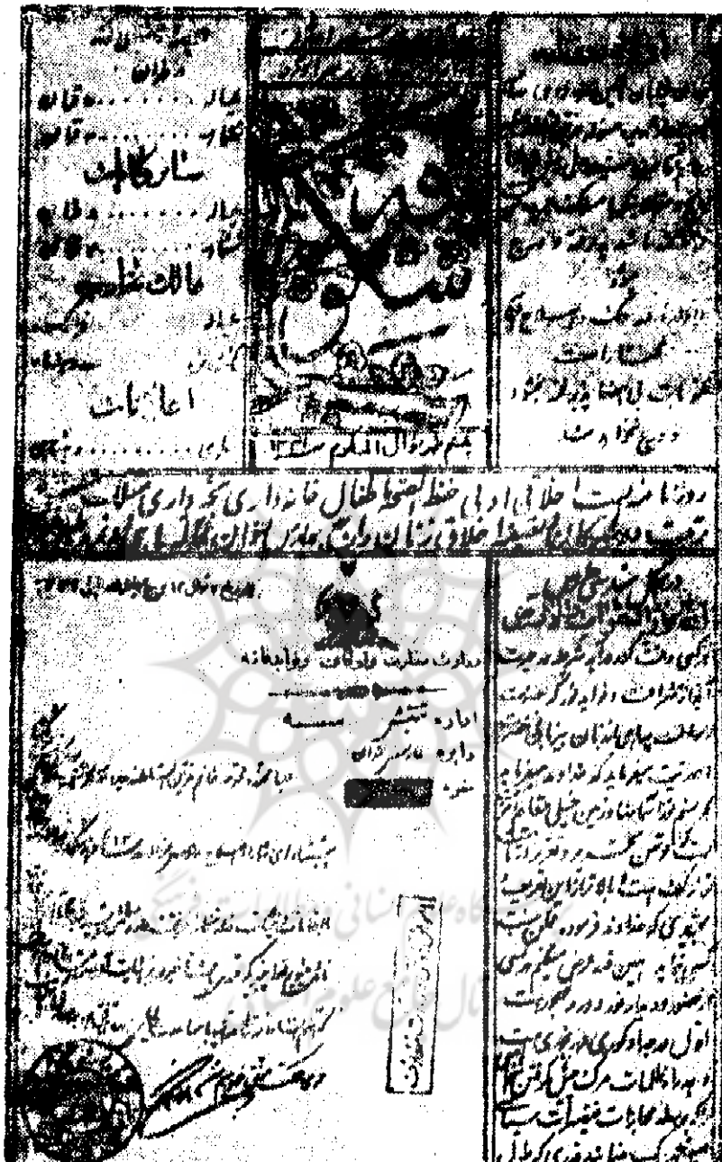
تصویر صفحه اول روزنامه شکوفه