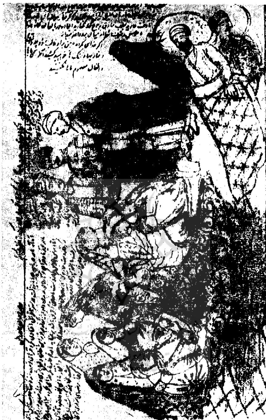
آدمه پیر دیگری از کالیگاتورهای انتقامی روزنامه شکوفه