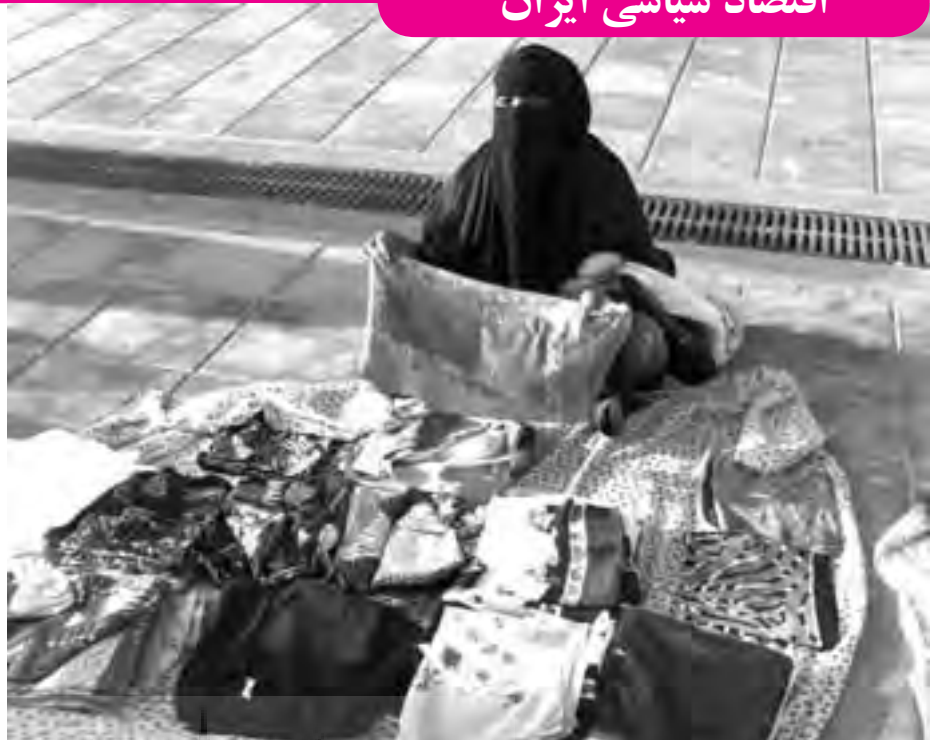
افزایش نرخ بیکاری در کشور