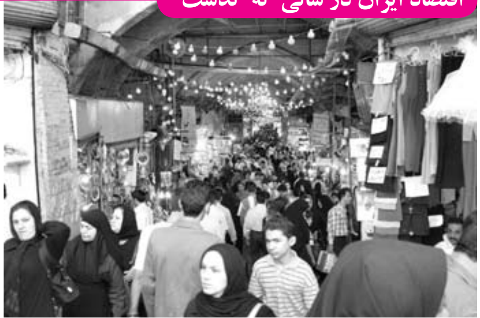
سالی که گذشت