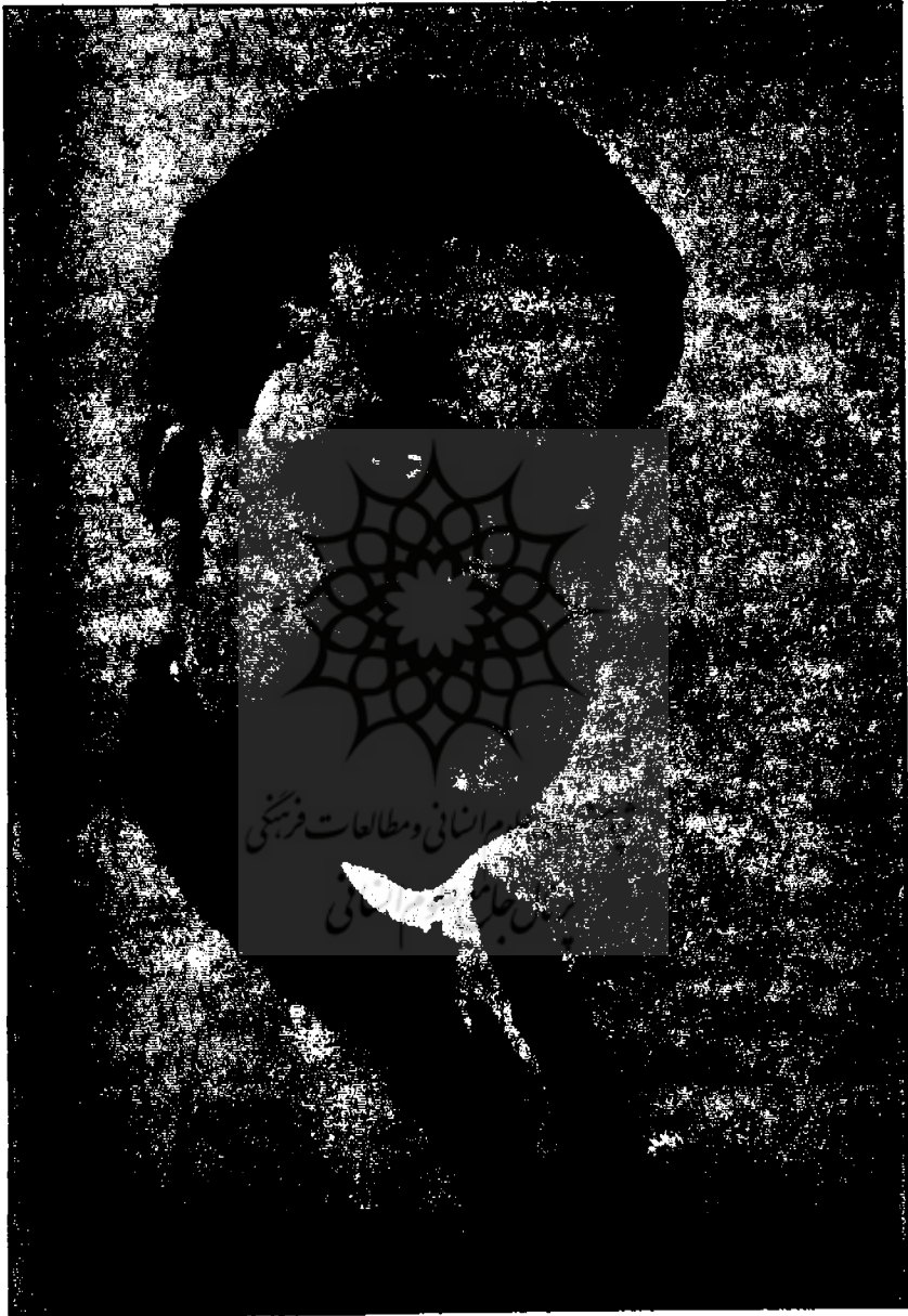
آردو طریان، بازیگر و کارگردان کاتر