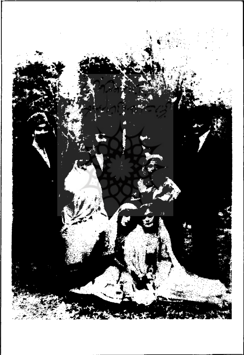
نمایش آرشین مالان از گروه تئاتر زنان