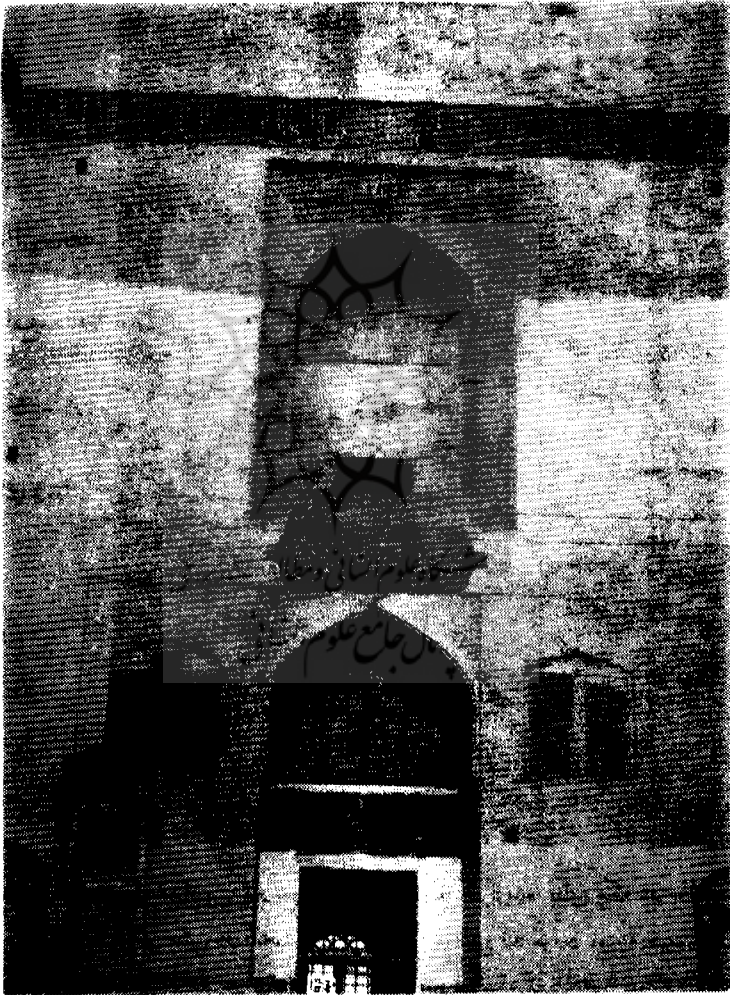
نمای قسمتی از ایوان مسجد جامع سمنان

قطعه مردم سرخه سمنان که در ۲۰ کیلومتری جنوب غربی سمنان واقع است از تخفیف مقرر برخوردار نبودند و آنهم بطوریکه در متن فرمان ذکر شده - است بعلت مذهب تسنن مردم آن قریه بوده است (لازم به تذکر است که مردم