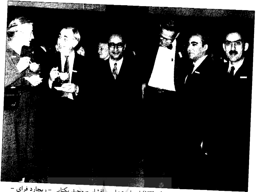
• رم - کنگره ایرانشناسی (اواخر دهه ۱۳۴۰) از راست: ایرج افشار - مجید یکتایی - ریچارد فرای - شجاع‌الدین شفا - برنارد لوئیس و میس لمبتون