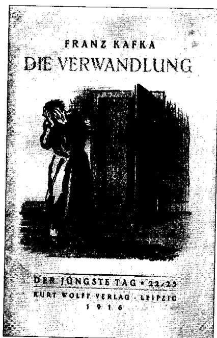
• روی جلد آلمانی کتاب مسخ