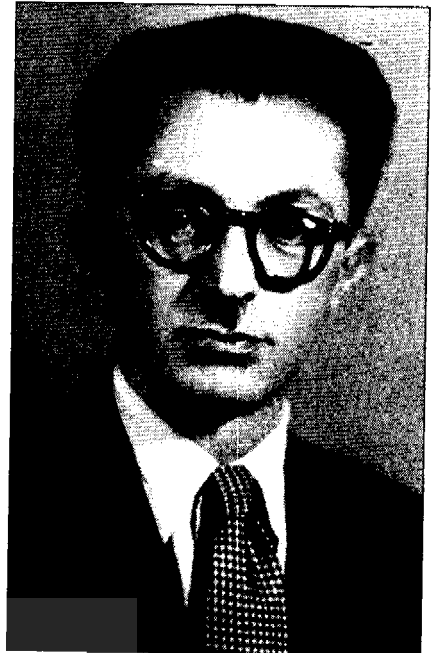
• صادق هدایت

برای نمونه در توصیف هدایت از میراث یهودی کافکا به بازتاب‌های صریحی از بیزاری هدایت نسبت به بنیادهای مذهبی در ایران برمی‌خوریم. در نوشته‌ای از کافکا به نام «نامه به پدرم» هدایت تصور می‌کند که به ریشه‌های اعتراض کافکا به یهودیت دست یافته است. قطعه‌ای از این نوشته که در آن کافکا از این‌که مجبور شد به معبد برود با انزجار سخن می‌گوید، سرچشمه برداشت هدایت از رفتار کافکا نسبت به یهودیت می‌شود. هدایت درباره دوستی کافکا با ماکس برود، که صهیونیست شد و کافکا را هم به جنبش صهیونیستی معرفی کرد، می‌نویسد: «ماکس برود از او می‌خواست و می‌کوشید که او را مجدداً به یهودیت بازگرداند، اما موفق نشد. کافکا به دوستش می‌گوید: من چه وجه مشترکی با یهودیان دارم؟» هدایت را به‌خاطر پرداختن به جزئیات بیوگرافی کافکا نمی‌توان به تحریف متهم کرد. این درست است که کافکا واقعاً به پدرش نامه‌ای نوشته بود که در آن پیوندهای ظاهری پدرش به مراسم یهودی را به‌باد تمسخر گرفته بود. این هم درست است که کافکا نسبت به صهیونیسم بیش از دوست مورد اعتمادش ماکس برود، تردید داشت. اما، امکان ندارد که کافکا را از میراث یهودی خود یکسره جدا در نظر گرفت.