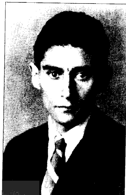
• فرانتس کافکا

این دنیا جای زیست نمی‌باشد و خفقان‌آور است، برای همین به جستجوی «زمین و هوا و قانونی» می‌رود تا بشود با آن زندگی آبرومندانه کرد. کافکا معتقد است که «این دنیای دروغ و تزویر و مسخره را باید خراب کرد و روی ویرانه‌هایش دنیای بهتر ساخت.» اگر دنیای کافکا با پوچ دست به‌گریبان است دلیل این نیست که باید آن را با آغوش باز پذیرفت، بلکه شوم است. احساس می‌شود که کافکا پاسخی دارد، اما این پاسخ داده نشده است. در این آثار ناتمام او جان کلام گفته نشده است. ۱ به این ترتیب، تعجبی ندارد اگر میان مقاله‌ی هدایت درباره‌ی کافکا و رساله‌ی او درباره‌ی «عمر خیام» همانندی‌هایی یافت شود. علیرغم تفاوت‌های عظیم بین خیام و کافکا، هدایت در ارزیابی آثارشان، از زبانی دقیقاً یکسان برای جهان‌بینی آن‌ها استفاده می‌کند: «خیام می‌خواست این دنیای مسخره، پست، و ناجور را از بین ببرد و بر ویرانه‌های آن دنیای منطقی‌تری بسازد.» ۲ خیام هم مانند کافکا علیه سنت و استبداد شورش کرده بود: «خیام از دست مردم زمانه‌اش خسته و بیزار بود، اخلاقیات و آداب و رسوم آن‌ها را با کنایاتی گزنده محکوم می‌کرد و تعالیم اجتماعی را اصلاً قبول نداشت.» ۳ شورش و مخالفتی را که هدایت درست یا