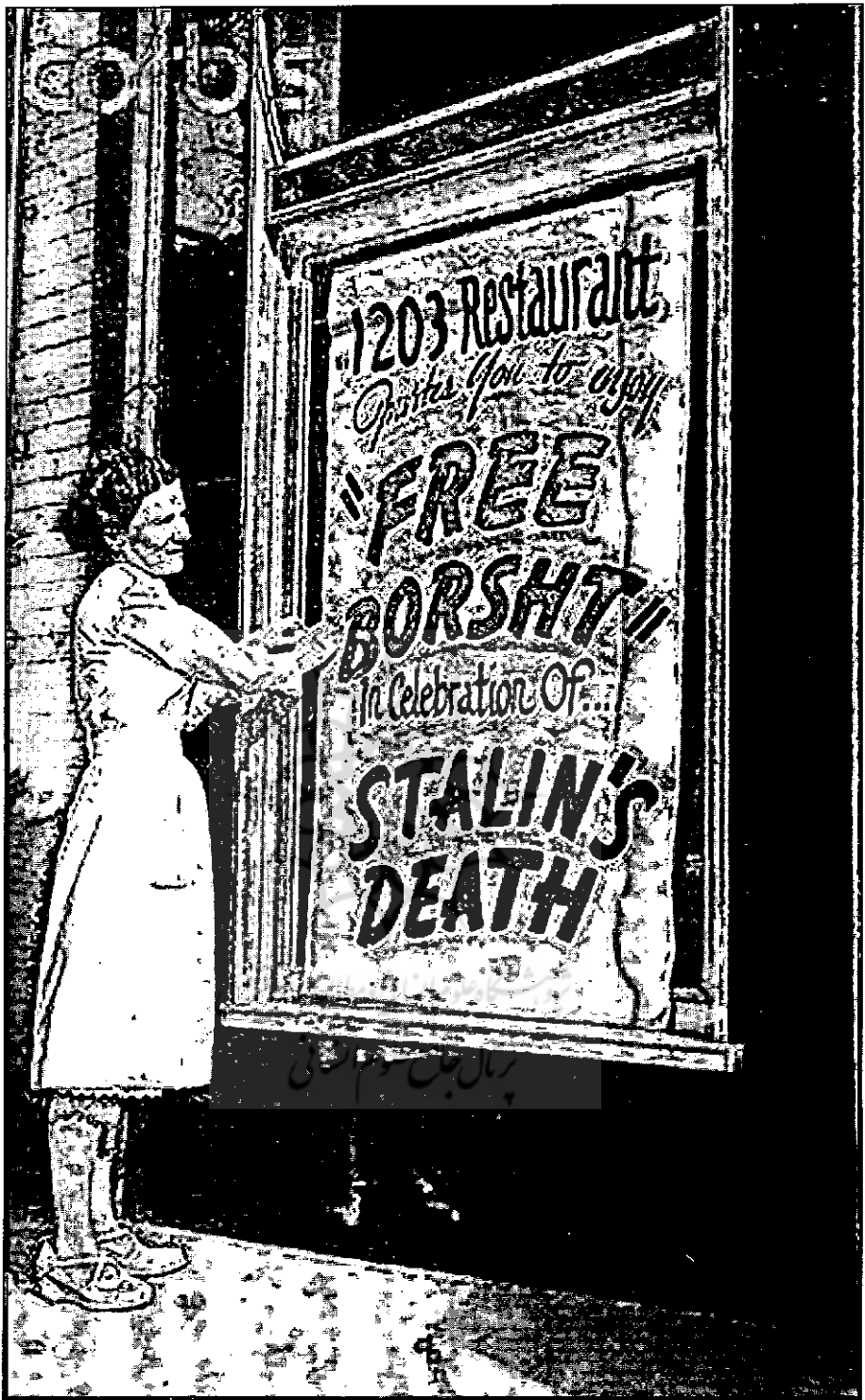
● روی پوستر نوشته شده: بُرش مجانی به مناسبت مرگ استالین