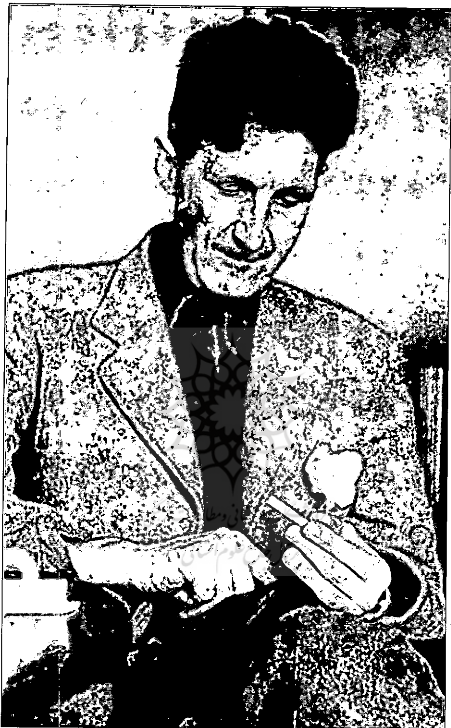
● جرج اروول در زمان نگارش مقاله نویسندگان و ایدئولوژی