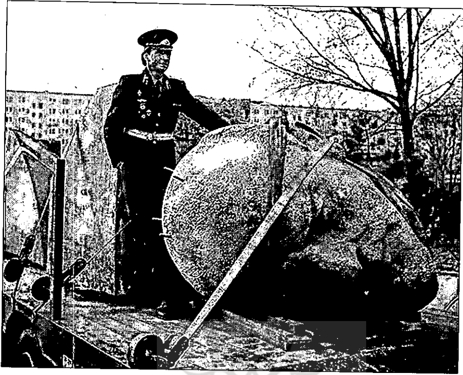
هان ای دل عبرت بین...