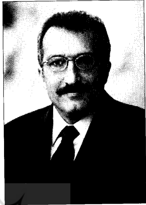
● دکتر عباس میلانی نویسنده کتاب «نام آوران ایران»

ساختمان سازی، بانکداری و امور مالی، معماری و مهندسی، کشاورزی، ادبیات، پژوهش، تاریخ، آموزش و پرورش، هنر، طب، ورزش و امور خیریه می پردازد به نام های زیر محدود شده است: