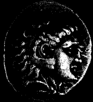
زورف و سپهر