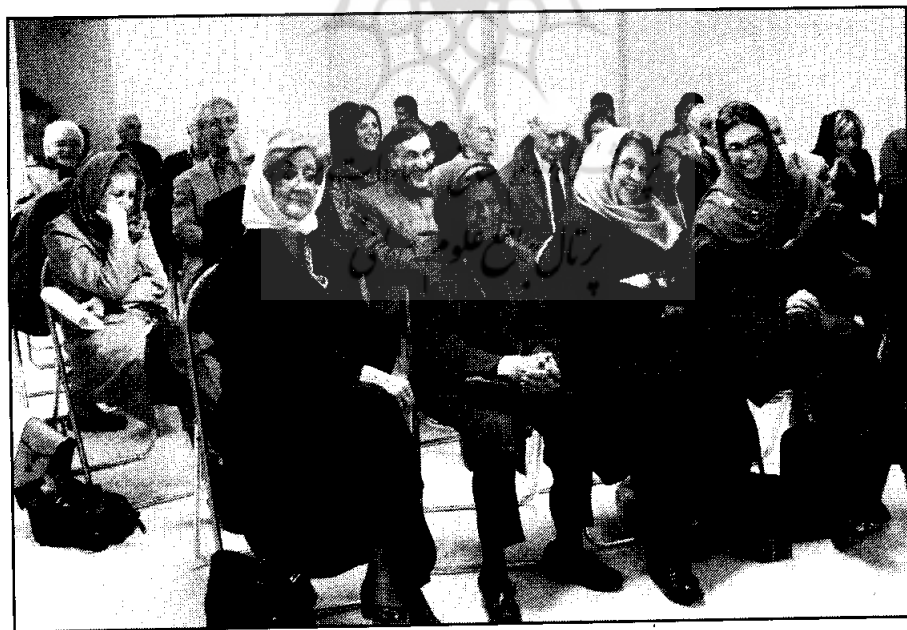
● صحنه‌ای دیگر از نشست «مطالعات ایران باستان» در نشر فرزانه روز