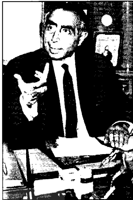
● دکتر علی امینی

عملیات مشخصی قرار گیرد، متغیرهای ناشناخته وجود داشت؛ تجربه‌های بعدی هم نشان داد که متغیرهای ناشناخته در جامعه ایران بسیار است و معادله‌هایی که در جامعه‌های دیگر پاسخ می‌داد، در ایران جواب نمی‌داد، یا عیناً جواب نمی‌داد. به گفته مارک گازیوروسکی، پژوهش‌گر امریکایی و متخصص تاریخ معاصر ایران، هدف از اصلاحات در ایران، استقرار مردم‌سالاری نبود و امریکایی‌ها نگران مردم‌سالاری در ایران نبودند، بلکه می‌خواستند اصلاحاتی در ایران صورت بگیرد و رأس قدرت به اصلاح‌گر و نوآور تبدیل شود. ۱