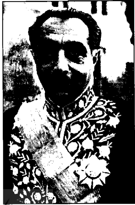
● دکتر علی امینی

سطح تولید و مصرف را در روستاها افزایش دهند و به این ترتیب انگیزه نیرومندتر و زمینه گسترده‌تری برای توسعه اقتصادی سراسر کشور فراهم آورند. اما تحقق یافتن این طرح به پشتوانه‌ها و برنامه‌های منظم و پی‌گیری نیاز داشت که دولت باید به اجرا می‌گذاشت، که نگذاشت. در طرح امینی - ارسنجانی در نظر گرفته نشده بود که دولت ناکارآمد، فاسد و بدون نیروهای تربیت شده برای اصلاحات، و بی آن که ماموران اجرایی اخت کرده به روش‌های منسوخ دیوان سالارانه، به بطن ماجرای راهی یافته باشند که اصلاحات نام گرفته بود، چه گونه ممکن بود بتوانند برنامه‌ای اصلاحی را به اجرا بگذارند؟ اجزای برنامه اصلاحات به ناگزیر باید همخوانی داشته باشد. اصلاحات ارضی را بدون اصلاحات در نیروهای اجرایی و انتظامی، و در واقع بدون اصلاحات در ساختار دولتی، چه گونه می‌شد به اجرا گذاشت؟ ارسنجانی شماری نیروی جوان، علاقه‌مند و شاید هم آرمان‌گرا و مردم‌دوست یا میهن‌دوست دور خود جمع کرده بود که برخی از آنها به وی اعتماد و علاقه داشتند، اما با این جمع محدود، او چه گونه می‌توانست برنامه‌ای گسترده را در سراسر کشور، در دوردست‌ترین نقاط، در جایی به اجرا گذارد که شماری از روستاها ارتباطی با کانون‌های شهری نداشتند و شیوه زیست و معیشتشان از حیث زمانی از سده‌های میانه بیرون نیامده بود؟ بر فرض که برنامه