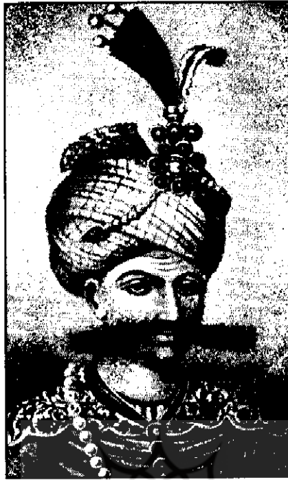
● شاه عباس

من زیبا جلوه می‌کنند و از حرف زدن با مردان امتناعی ندارند و مانند مردان این دیار در برخورد بسیار مؤدب و مهربان هستند. همگی مردم مازندران دوست دارند خانه خود را در اختیار میهمان قرار دهند و در قبال او با کمال ادب و رأفت رفتار کنند. من در هیچ جای دیگر دنیا ندیده‌ام مردم دهات آن قدر دارای تمدن و آداب و رسوم پسندیده باشند و ملاحظه کردم ایالت هیرکانیا [نام قدیمی بخش جنوب و جنوب شرقی دریای مازندران] که به قول قدما باید عاری از تمدن و جایگاه پلنگان وحشی باشد زیباترین نقطه‌ای است که تا به حال در آسیا دیده‌ام و مردم آن متمدن‌ترین و با ادب‌ترین مردمی هستند که ممکن است در دنیا وجود داشته باشد. ۱