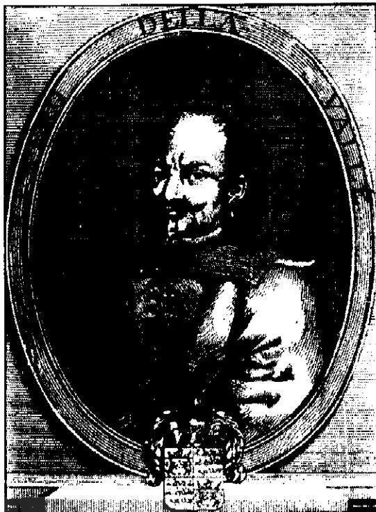
● تصویر پیتر دلاواله جهانگرد ایتالیایی که به ایران آمد

فقط خصلت میهمان‌نوازی ایرانیان نبود که توجه خاص بیگانگان را به خود جلب می‌کرد، بلکه عامل مهمی که بیش از آن علاقه و احترام مسیحیان را جلب می‌نمود مدارای مذهبی مردم ایران بود. در زمانه‌ای که مسیحیان در قلمرو عثمانی مورد زجر و آزار قرار می‌گرفتند و کشورهای اروپا گرفتار جنگهای مذهبی بود و مسیحیان مخالف مذهب حاکم - کاتولیک‌ها و پروتستان‌ها - در زادگاه و کشور خود در اروپا در نگرانی و هراس به سر می‌بردند، ایرانیان با مسیحیان از هر فرقه‌ای که بودند با مدارا رفتار می‌کردند و هیچ‌گونه آسیبی به آنان نمی‌رساندند. خوی مردمی و خصلت انسان‌دوستی ایرانی تعیین‌کننده رابطه‌های ایرانی با پیروان مذهبهای مختلف بود. ایرانی با خوشرویی با مسیحیان دیدار می‌کرد، و از آن مهمتر، در روزگار کینه‌ورزی مذهبها با یکدیگر، با مسیحیان به ملائمت درباره مذهب به بحث می‌پرداخت و در جریان بحث که معمولاً می‌بایست با ابراز تعصب و خشونت همراه می‌شد ادب و نزاکت را حفظ می‌نمود. این خصلتهای اجتماعی ایرانی که تحسین و احترام اکثر مسیحیانی که درباره ایران کتاب نوشته‌اند برانگیخته است، به مسیحیان امکان می‌داد با آرامش خاطر در ایران دوران شاه عباس اقامت گزینند و با ایرانی رابطه‌های غیر خصمانه و حتی دوستانه داشته باشند. مسیحیان با به یاد داشتن بیدادگرهای ترکان عثمانی و ستمهایی که بر آنان روا