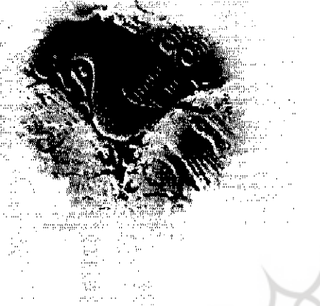
نویسنده: علی اکبر زائر