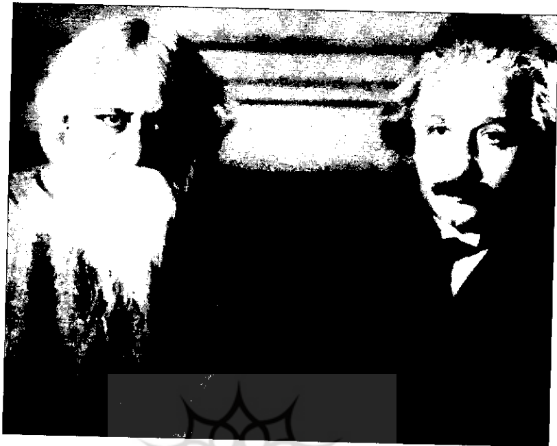
● تاگور و انیشتن