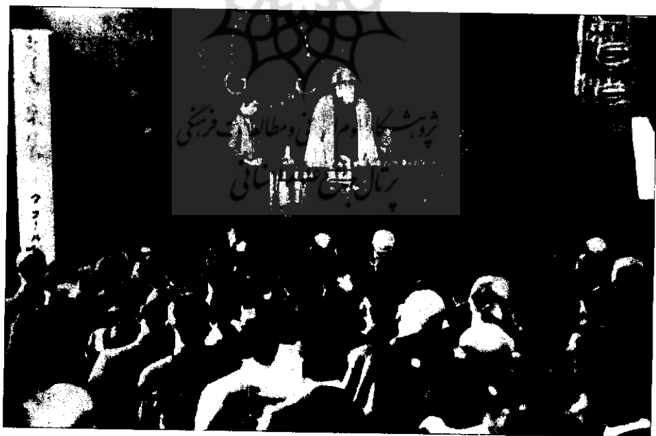
● سخنرانی تاگور در شهر توکیو ۱۹۲۹