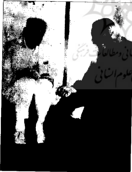
● سیلوین و تاگور ۲۲ - ۱۹۲۱