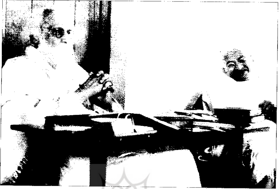
● رابیندرانات تاگور و گاندی در شانتی نیکتان - ۱۹۴۰