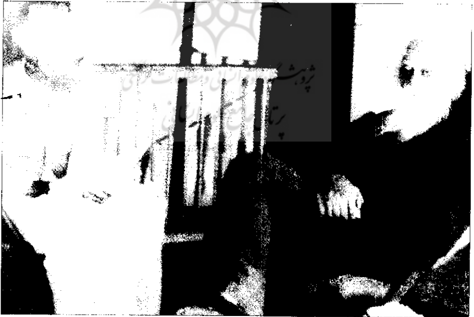
● جواهر و لعل نهرو و تاگور در شانتی نیکتان - ۱۹۳۹