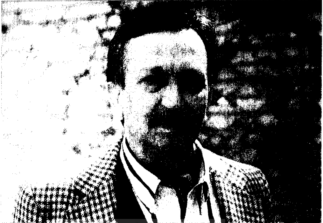
● جمشید ارجمند

سپردند به امید آنکه او با دانش فقهی و حکمتی خود برایشان بهشت بسازد. و کالون به جای بهشت جهنمی ترتیب داد. چندان ستم کرد و کشت و سوزاند و مصادره کرد و نفی بلد نمود و زبانها و چشمها و گوشها را بست که مردم ناگزیر برخاستند و خود او را اخراج کردند. اما بدبختانه هرج و مرجی که در غیاب نظام مسلط حکومت دینی او در ژنو پدید آمد مردم را وا داشت تا با آزمون آزموده و بازگرداندن او به حکومت یکی از بزرگترین اشتباهات اجتماعی را مرتکب شوند. کالون در دومین دوره حکومتش با تکیه بر دست بالایی که پیدا کرده بود و کینه‌ای که در دل داشت، سیاهترین و خشن‌ترین دوره‌های تاریخی را در سویس پدید آورد. محاکمات مذهبی و تفتیش عقاید و جمع‌آوری و سوزاندن کتابهای عرفی و تعطیل میخانه‌ها و نفی و تهدید موسیقی و شادی و هرگونه تظاهر آزاد زندگی و سرکوب شدید و اعدام مخالفان با آتش هیزم، از مشخصات این دوره است.