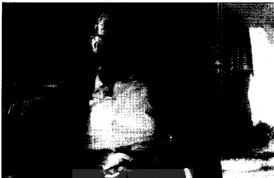
● پروفیسور ریچارد نلسون فرای (کوشکک لورا تیر ۸۳)

هنگامی که درباره تغییراتی که در طول زندگی من رخ داده است می‌اندیشم، چند تغییر هم موجب نگرانی است و هم امیدبخش. نخست، جامعه و بشریت است که در دنیای غرب، به ویژه پس از جنگ جهانی دوم، رو به اضمحلال نهاده، اما در خاورمیانه تقریباً تا پایان این قرن دوام داشته است. اعتماد کردن و مهمان‌نوازی که در گذشته مورد نظر بود به یک تردید فلسفی و انزوای کنونی تبدیل شده است. پزشکان مدتی است که دیگر بیمار ندارند بلکه مشتریانی دارند. وکلا نیز موکل ندارند بلکه مشتریانی دارند و تعهدات قدیمی احترام و اعتماد از بین رفته است. فن‌آوری از بسیاری جهات زندگی را آسان‌تر کرده است، اما ماشین‌ها در تصمیم‌گیری‌ها نیز جای انسان را گرفته‌اند. برای نمونه، وقتی سرانجام، پس از فشار دگمه‌های بسیار و شنیدن یک پیام ضبط شده، کسی را در آن طرف خط تلفن می‌یابید تا از او پرسش ساده‌ای را پرسید ممکن است از مواجهه با انسانی که در پاسخ دادن به پرسش شما به شبه ماشین تبدیل شده است بهت‌زده شوید. انگار که همه ما برای ادامه بقا می‌بایست در درون یک قالب قرار گیریم.