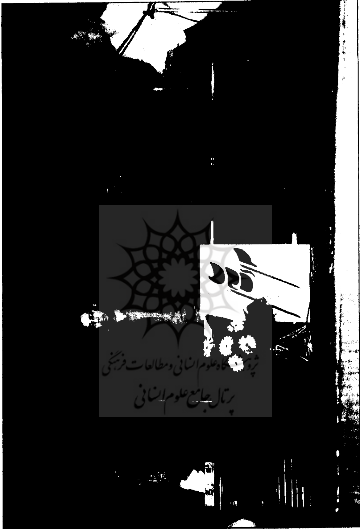
● میزگرد با حضور: رضا چایچی - پری صابری - علی دهباشی و مهرداد کلاتری