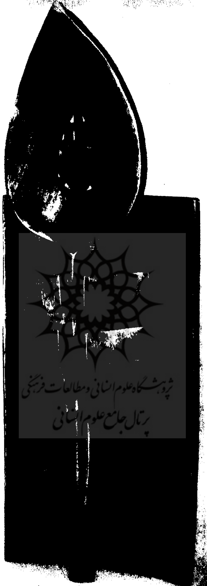
● دیوار و سرو ۱۳۸۰ - برنز، ۷ × ۱۴/۵ × ۴۶ سانتی متر