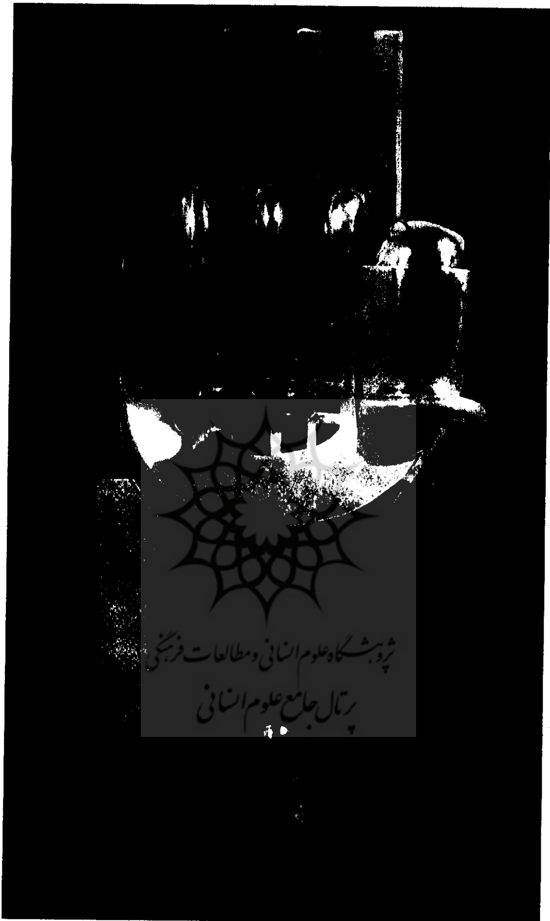
● دست بر دست، ۱۳۷۹ - برنز، ۵۱ × ۲۵ × ۱۲/۵ سانتی متر