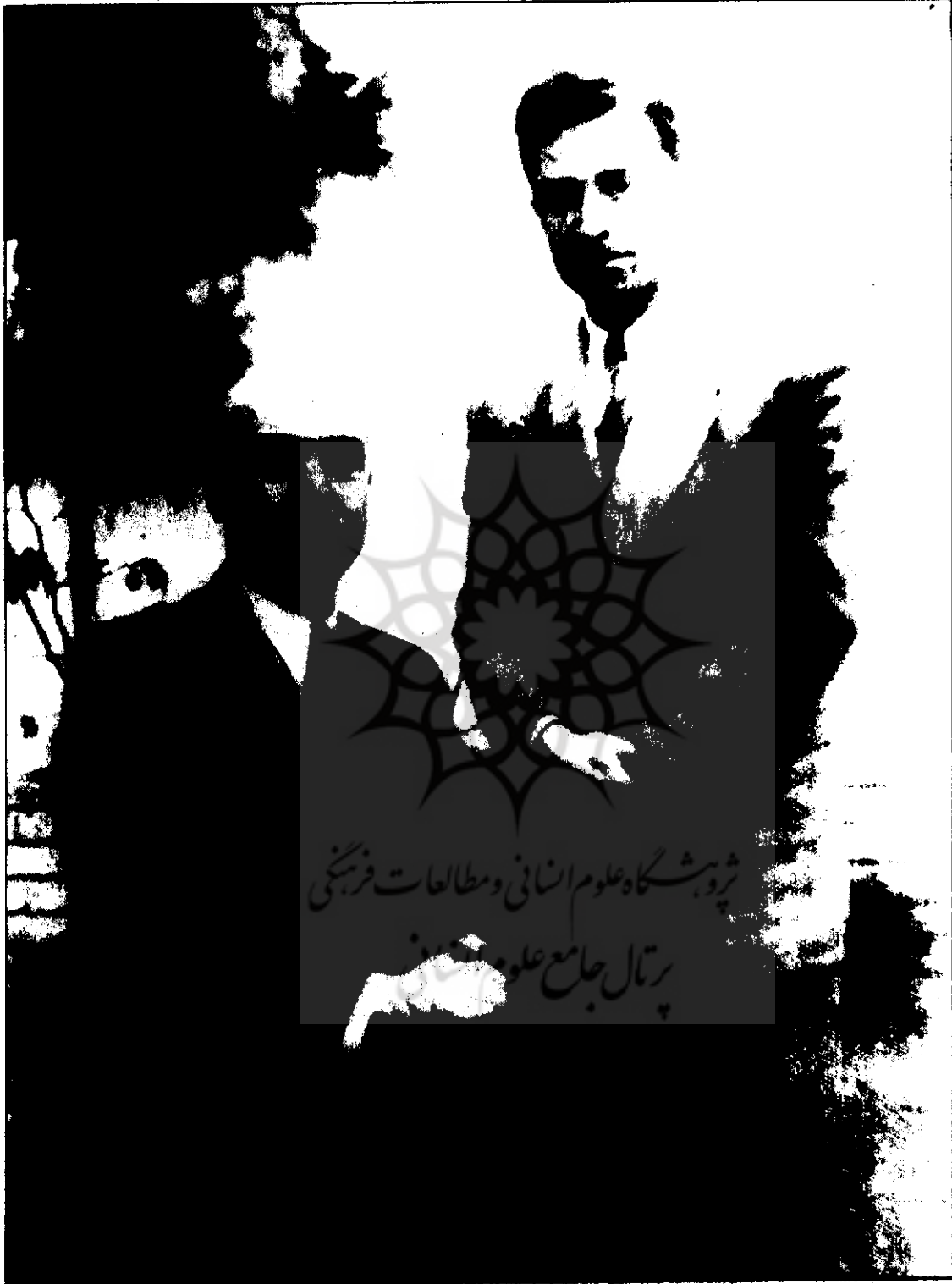
● کتبل علیقی وزیرى در کنار لطف‌الله معتم بیان (اواخر سالهاى ۱۳۶۰)