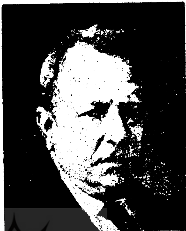
● بند توکروچه

چیزهای واقعی متعددی که آن نامها تداعی می‌کنند، فکر کنیم. به این جهت، محتوای آنها نامتعیین است، و این عدم تعین به معنای تهی بودن آنهاست. هر تاریخی جدا از اسناد زندهٔ مربوط به آن، شبیه این مثالها و، بنابراین، روایتی میان تهی است، و چون میان تهی است، عاری از حقیقت است. آیا حقیقت دارد یا ندارد که نقاشی به نام پولوگنوتوس وجود داشت که چهرهٔ میلتیادس ۱ را نگاشت؟ به ما خواهند گفت که حقیقت دارد، زیرا یک تن یا چند تن از کسانی که او را می‌شناختند و نقاشی مورد بحث را دیده بودند، به وجود آن گواهی داده‌اند. ولی باید پاسخ دهیم که قضیه برای این یا آن گواه حقیقت داشته است، و برای ما نه راست است نه دروغ، یا (همان معنا به تعبیری دیگر) راست است تنها بر پایهٔ شهادت آن شهود - یعنی به دلیل عارضی، حال آنکه حقیقت همیشه نیازمند دلایل ذاتی است. و چون قضیهٔ مورد بحث راست نیست (نه راست است نه دروغ)، پس بی‌فایده است، زیرا جایی که هیچ چیز نیست، برای شاه هم هیچ حقوقی نیست، و جایی که ارکان مسأله مفقود است، ارادهٔ مؤثر و نیاز مؤثر به حل آن - و نیز امکان حل مسأله - مفقود است. بنابراین، نقل آن داوریه‌های میان تهی