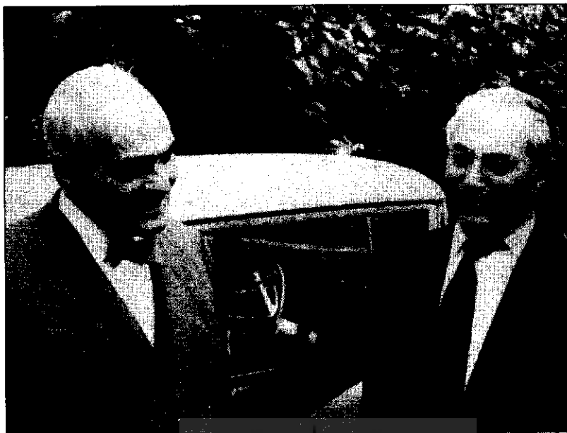
تقی‌زاده در دست چپ و جمالزاده در دست راست در تابستان سال ۱۳۷۷ هجری قمری (۱۹۵۷ میلادی) در ژنو.

مجلس در صف مخالفان تغییر سلطنت قرار گرفت. البته خود را با خطر بیکاری یا تهدید هم روبرو می‌دید. در نامه‌ای به حسین علا، به تمایل خودش، او و دکتر محمد مصدق به خروج از مجلس و انزواگزیدن اشاره کرده و گفته است که مصدق چون مناعت و تمکن داشت، توانست ما نتوانستیم (۱۳۷۵ ش، نامه ش ۱۷، ص ۱۳۴). تقی‌زاده در جای دیگری می‌گوید که مصدق در جریان تغییر سلطنت به وی گفته است: «... می‌دانم برای شما از نظر مادی امکان آن نیست که بی‌کار بمانید، خوشوقت می‌شوم تا به هر نحو که مایل باشید ترتیباتی بدهم که زندگی و معیشت شما مختل نماند» (۱۳۷۲ ش، ص ۶۶۱ - ۶۶۲). تقی‌زاده پیشنهاد دکتر مصدق را، که بعدها کشمکشهایی سیاسی با هم داشتند، نپذیرفت و ترجیح داد همکار حکومتی باشد که خود هم رأی موافق به آن نداده بود.