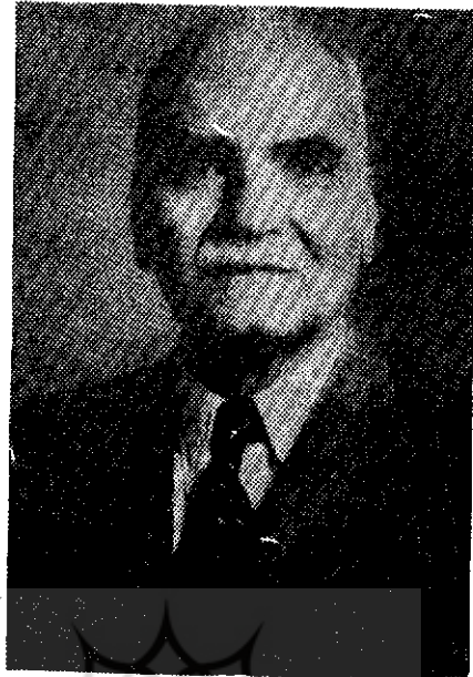
● سیدحسین تقی‌زاده

یافت، تا جایی که به همراه تربیت و جمعی دیگر، برای ترویج این اندیشه‌ها، محفلی به اصطلاح روشنفکرانه در تبریز تشکیل داد، و در ۱۳۱۹ ق همراه همان دوستانش به تأسیس مدرسه‌ای به نام تربیت اقدام نمود که هدف آن ترویج روش تحصیلی غرب و اندیشه‌های غربی بود، اما بر اثر مخالفت شماری از روحانیان و حکمی که به تفسیق او دادند مدرسه دایر نشد و دوستان تقی‌زاده همگی پراکنده و متواری شدند و خودوی نیز اگر حرمت پدر و خانواده در میان مردم تبریز نبود، با مشکلات جدی روبرو می‌شد (همو، ۱۳۷۲ ش، ص ۲۶ - ۲۹؛ طاهرزاده بهزاد، ص ۴۰۹). تقی‌زاده به مرحله‌ای از یقین و اعتقاد رسیده بود که از مسیرش دست بر نمی‌داشت. در همان سالها عضو جمعیتی بود به نام «علیهم» که به بحثهای ادبی، علمی، سیاسی و نقادی بعضی اقوال خطبا و ذاکرین و برخی شنن می‌پرداختند و نقادبها را به هزل و هجو نیز همراه می‌کردند (ناطق، ص ۱۸۶). او با همکاری تربیت و یوسف خان اعتصام‌الملک (پدر پروین اعتصامی) کتابفروشی تربیت را تأسیس کرد که کتابهای فرنگی و عربی جدید می‌فروخت و محل آمد و رفت متجددان و آزادیخواهان آذربایجانی بود. در دوره استبداد صغیر، این کتابفروشی را غارت کردند و آتش زدند (تقی‌زاده، ۱۳۷۲ ش، ص ۲۹). در ۱۳۲۰ ق، با همکاری همان دوستان، دو هفته‌نامه گنجینه فنون را منتشر کرد، که پس از یک سال و نیم انتشار، و ظاهراً بر اثر سفر تقی‌زاده و تربیت به خارجه و شیوع و با در ایران، تعطیل شد.