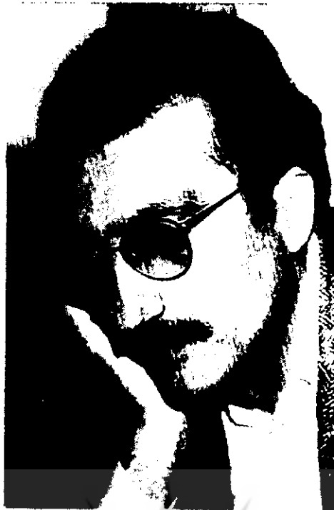
● دکتر عباس میلانی

ولی نه حتی از دید یک حکومت انقلابی و اسلامی، بلکه در معیارهای غربی هم، بسیاری از آنچه در دوران ۱۳ ساله حکومت هویدا رخ داده بود، محاکمه و مجازات می‌طلبید. نقش نخست وزیر، مطابق قانون اساسی مشروطیت ایران، آن نبود که هویدا بازی می‌کرد. نخست وزیر در برابر مجلس مسئول بود. نخست‌وزیر مسئول کارهای وزرا و معاونانش بود. در حالیکه هویدا این چنین نبود. او اهل تسلیم بود، اهل این بود که تعداد هر چه بیشتری را، بهر قیمتی، راضی نگاه دارد، اهل این بود که وضع موجود را حفظ کند.