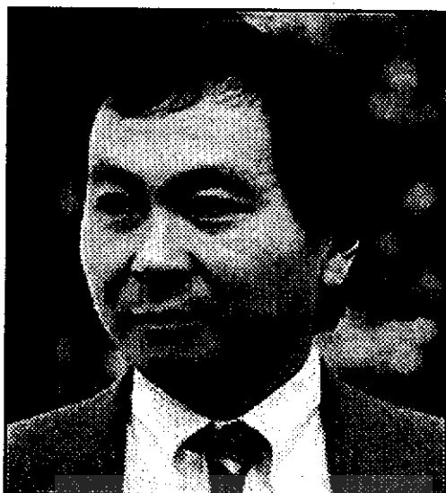
○ فرانسیس فوکویاما

ضد اجتماعی در قالب رفتارهای «تند و افراطی و بیمارگونه» بروز کند. نخستین واکنشها به فلسفه تاریخ فوکویاما در محافل دانشگاهی عموماً انتقادآمیز بود. به نظر بسیاری از افراد که جهان را بسیار دور از حد کمال و ویژگیهای آن را جنگهای وحشیانه و سرکوب و توتالیترسم و ستمگری می دیدند، نظریه فوکویاما نامعقول و مهمل بود. منتقدان چپگرای و به اتهام رجزخوانیهای ناپخته و ناشیانه به شیوه سرمایه داران هدف نکوهش قرار می دادند. منتقدان راستگرا استدلال می کردند که دموکراسی لیبرال به هیچ روی از خطرهای جهانی مانند کمونیسم ایمن نیست. با اینهمه، کتاب فوکویاما، پایان تاریخ و آخرین انسان، ۱ آشکارا در دل مردم جایی باز کرد و در امریکا و فرانسه و کشورهای دیگر در شمار پرفروش ترین کتابها قرار گرفت. او اگر هیچ کار دیگری هم نکرده بود، دست کم موفق شده بود برخی از بنیادی ترین مسائل فلسفه نظری تاریخ را وارد عرصه بحث عمومی کند.