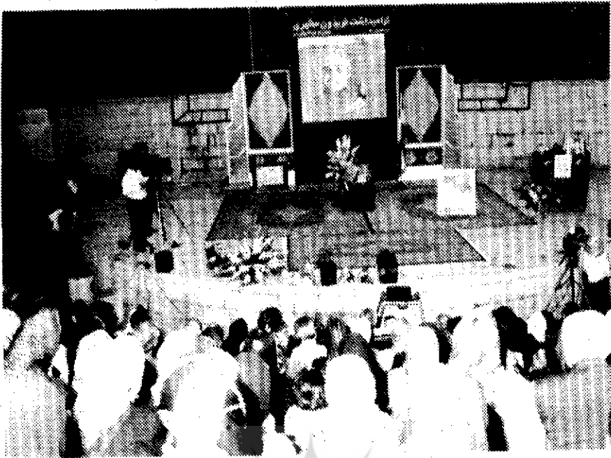
● صحنه‌ای از مراسم بزرگداشت فریدون مشیری

نهانی‌اش می‌داد شور و شوق دو چندان به مراسم بخشید. فریدون مشیری از پس پنجاه سال قلم زدن و شعر سرودن شعرهای نانوخته‌ای از مهر و عاطفه لبریز داشت که با نگاه پر مهرش به دوستانش تقدیم کرد.