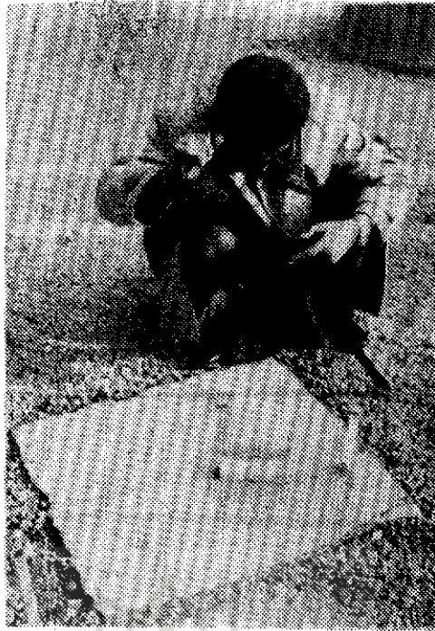
● نجمی دیده

درباره این سنگ، روز اول فروردین صبح زود پیش از طلوع آفتاب، با وسائلی از نقشه و قطب‌نما و ساعت آفتابی و دوربین چشمی و دوربین عکاسی، در محل نصب سنگ حاضر شده، مترصد برآمدن آفتاب از پشت کوه رحمت نشستیم. با بیم از ابری شدن هوا، خوشبختانه، توانستیم، در سر ساعت هفت و سی دقیقه، شاهد طلوع خورشید از ستیغ کوه رحمت و افتادن سایه آن بر روی ساعت آفتابی که بر روی سنگ قرار گرفته بود باشیم و سایه نخط شعاع خورشید را از زیر گوشه مربع که دارای علامت کوچکی است تا مرکز دایره که بر سنگ حک شده مشاهده کنیم. از اینجا معلوم شد که این سنگ مربع که اندکی اریب نصب شده موقعیت کل صفت تخت جمشید را نسبت به کوه رحمت و خورشید و محل طلوع آن از پشت کوه نشان می‌دهد و بی‌گمان آن را از روی محاسبات دقیق نجومی و علمی در کف این کاخ نصب کرده‌اند و وجود همین سنگ و عملیات نجومی بر روی آن در عهد هخامنشیان بوده است که باعث پدید آمدن این همه افسانه‌ها و داستانها مربوط به جمشید و نوروز و تخت جمشید گردیده است. توضیح آن که این آزمایش تنها در دو روز معین از سال یعنی نوروز و مهرگان در بامدادان امکان پذیر است و بس وگرنه پاسخ مثبت به دست نخواهد آمد.