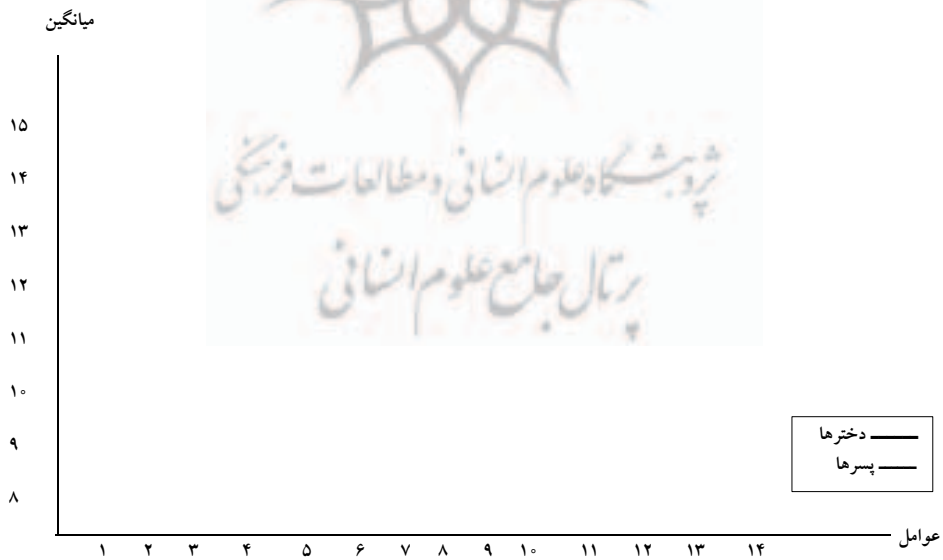
نمودار شماره ۲: میانگین‌های عوامل چهارده گانه آزمون ادواردز در آزمودنیهای دختر و پسر