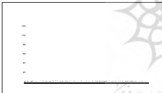
نمودار (۱): نمودار درختی تیپ‌های هم‌دید اصلی ایستگاه طبس

زمستانی فلورانس ایتالیا در طی دوره ۲۰۰۳-۱۹۹۸ پرداخته و اثر این تیپ‌های هوایی را بر روی سکنه قلبی بررسی کرده است. برناردی آدریانو و همکاران (۱۹۸۷) به شناسایی تیپ‌های هوایی بوجود آورنده آلودگی‌ها در ونیز ایتالیا پرداختند تا از این طریق بتوانند زمان این آلودگی‌ها را پیش‌بینی کنند. مک کابی و مولر (۲۰۰۲) به بررسی تیپ‌های هوایی نئوآورلئان در سال‌های ۲۰۰۰-۱۹۶۲ پرداختند و هم چنین اثرات انوسورا بر روی فراوانی و ویژگی‌های این تیپ‌های هوا مطالعه کردند. علیچانی (۱۳۸۱) هوای تهران را برای یک سال نمونه بررسی کرده و هشت تیپ هوا را معرفی نموده است. در این پژوهش نیز به شناسایی تیپ‌های هم‌دید هوای ایستگاه طبس در طی سال‌های ۱۳۸۳-۱۳۶۴ پرداخته شده و در آخر سه تیپ هوا شناسایی شد.