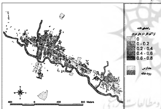
نقشه ۲: تراکم جمعیت در نواحی مختلف شهر هشترود

واقع شدن بخش مهمی از شهر در کنار حریم رودخانه سراسکند همان طور که گفته شد شهر هشترود در شمال رودخانه سراسکند واقع شده و این رودخانه از شرق به غرب جریان می‌یابد. شیب کلی شهر نیز به سمت این رودخانه می‌باشد. در بخش جنوبی، رودخانه سراسکند شهر را بطور کلی دربر گرفته و باتلاقی بودن قسمتی از حریم آن، از عوامل محدود کننده توسعه هشترود می‌باشد. شهرستان هشترود با توجه به این که یک شهر کشاورزی می‌باشد بیشتر مناطق مسکونی در کنار این رودخانه قرار گرفته‌اند.