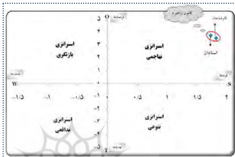
شکل ۲: نمودار تحلیل SWOT برای ارتقاء آموزش توسعه پایدار و محیط زیست در کشور از دیدگاه استادان و کارشناسان

سپس در مرحله بعدی برای دستیابی به مهمترین اولویتها در راهبردهای چهارگانه در زمینه آموزش حفظ محیط زیست و توسعه پایدار اقدام به تشکیل ماتریس عوامل ارائه شده توسط دو گروه گردید تا بر اساس مقایسه دو به دویی عوامل در زیرگروههای عوامل بیرونی (فرصت‌ها و تهدیدها) و درونی (قوت‌ها و ضعف‌ها)، راهبردهای چهارگانه رقابتی (SO)، راهبرد تنوع بخشی (ST)، راهبرد بازنگری و تغییر (WO) و راهبرد تدافعی (WT) بهتر شناسایی گردد. سپس در گام بعدی برای دستیابی به نتایج مناسب به تلفیق نظرات نمونه‌ها پرداخته شد که در راستای تحلیل وضعیت کشور بر مبنای اهداف ESD بر اساس مدل راهبردی ترسیمی راهبردهای چهارگانه عبارتند از (جدول ۵):