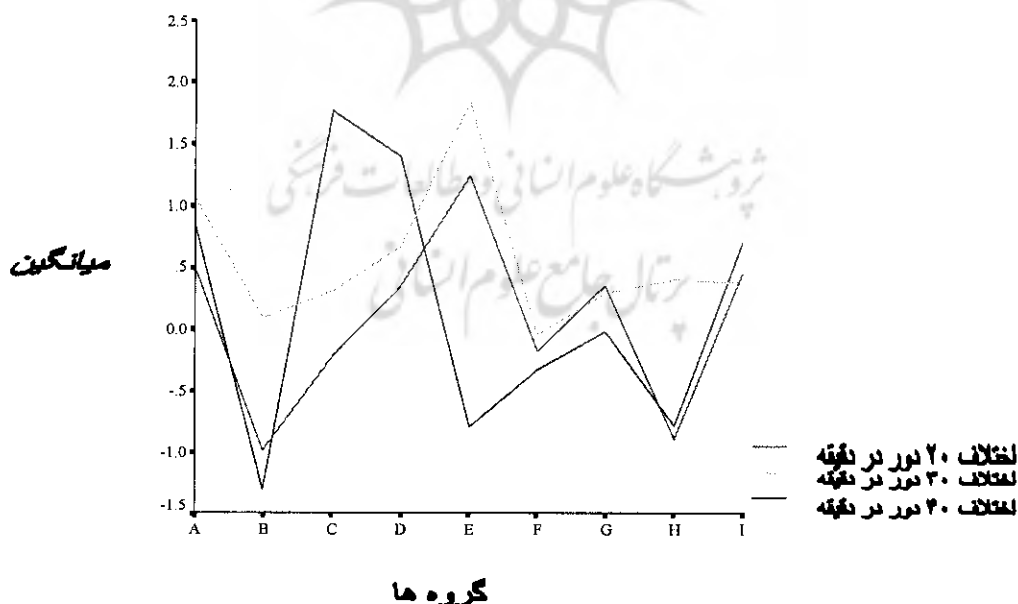
شکل شماره (۳) نمودار نیمرخ تفاضل نمره های پس آزمون و پیش آزمون در گروه های مختلف

آزمون یادداری تاخیری ۷۲ ساعت بعد از پس آزمون به عمل آمد و با بررسی آزمون های ۲۰، ۳۰ و ۴۰ دور در دقیقه، تفاوت میانگین گروه ها در سطح (P < 05\%) برای آزمون های ۲۰ و ۴۰ دور در دقیقه و نیز نمره میانگین گروه ها معنی دار بود. لذا بهترین عملکرد در مرحله یادداری گروه B (تصویرسازی ذهنی تصادفی صرف) و از طرفی گروه C (تمرین جسمانی قالبی و تصویرسازی ذهنی قالبی) پایین ترین عملکرد را داشت. همان طور که در شکل شماره ۳ مشاهده می شود گروه B در سرعت های پایین دارای بیشترین یادداری و گروه E کمترین یادداری بوده است.