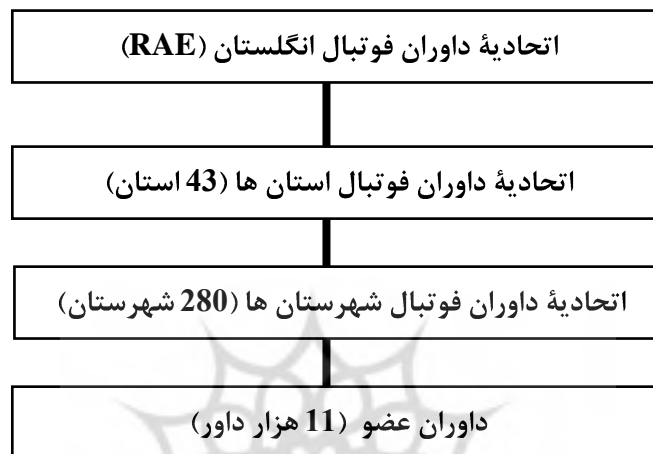
شکل 2- تشکیلات اتحادیه داوران فوتبال انگلستان