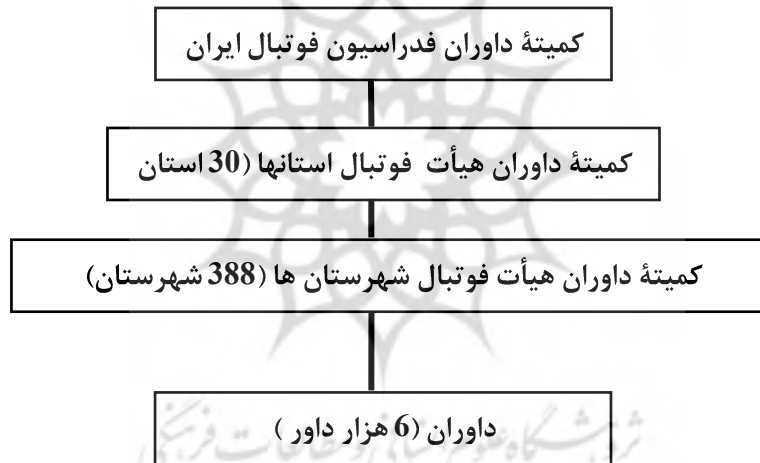
شکل 1 - تشکیلات داوری فوتبال در ایران

تشکیلات داوری فوتبال در ایران به کمیته داوران فدراسیون فوتبال و واحدهای استانی و شهرستانی زیرمجموعه آن محدود می‌شود، در حالی که تشکیلات داوری فوتبال در انگلستان شامل دو بخش مجزا با واحدهای مختلف است (کمیته داوران اتحادیه فوتبال انگلستان، اتحادیه داوران). واحدهای مختلف کمیته داوران اتحادیه فوتبال انگلستان و اتحادیه داوران انگلستان در شکل‌های 2 و 3 آمده است. عدم تطابق تشکیلات داوری فوتبال در ایران و انگلستان با مقایسه شکل‌های 1، 2 و 3 آشکار می‌شود که حاکی از تنوع و گستردگی بیشتر تشکیلات داوری انگلستان نسبت به ایران است (18).