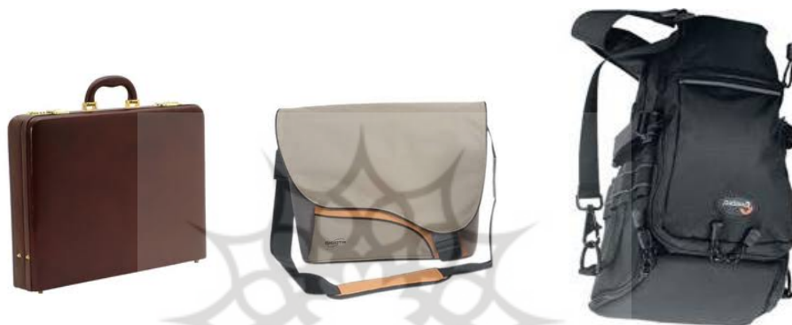
شکل ۱ - نمونه‌هایی از کوله پشتی (تصویر اول از سمت راست)، کیف شانه‌ای (تصویر وسط) و کیف دستی (تصویر سوم از سمت راست)

آزمودنی‌ها در نظر گرفته شد، زیرا در تحقیقات مختلف قبلی نیز وزن مجاز برای کیف‌های دانش‌آموزان همین مقدار توصیه شده است (۱۱، ۱۲، ۱۵، ۲۸). کیف‌های مختلف با کتاب‌ها و دیگر لوازم آموزشی مدرسه توسط محققان پر می‌شد.