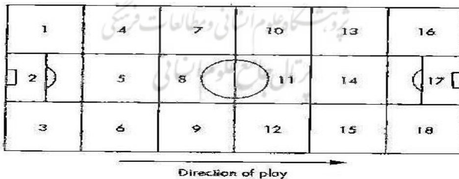
شکل ۱ - مناطق مختلف زمین مسابقه

یک دستگاه رایانه و یک دستگاه ویدئو برای بررسی فیلم ها به کار گرفته شد. بعد از مشاهده هر آسیب، فیلم نگه داشته شد و با استفاده از حرکات آهسته و بزرگ نمایی تصویر در مواقع مورد نیاز، اطلاعات مربوط در برگه مخصوص ثبت و یادداشت شد. در این تحقیق هر گونه رویدادی که در آن بازیکن به گروه پزشکی نیاز پیدا کرده و در زمان مسابقه درمان دریافت می کرد، آسیب دیدگی در نظر گرفته شد (۳۲). تعداد ساعاتی که بازیکنان در معرض خطر آسیب بودند نیز با این فرض محاسبه شد که در هر مسابقه ۲۲ بازیکن به طور کامل حضور داشته باشند و هر مسابقه ۱۰۰ دقیقه (۴۵ دقیقه زمان قانونی هر نیمه به علاوه ۵ دقیقه وقت های اضافی در هر نیمه) طول بکشد. میزان شیوع آسیب (IFRS) ۱ نیز به عنوان تعداد آسیب دیدگی در هر ۱۰۰۰ ساعت مسابقه محاسبه شد (۲۸، ۲۹). مکانیسم وقوع آسیب نیز شامل نبرد هوایی، دویدن، تکل کردن، مورد تکل قرار گرفتن، چرخیدن، برخورد و تصادم، لگد خوردن، شارژ شدن و شیرجه رفتن بود. همچنین بازیکنان با توجه به نقششان در مسابقه، به شش دسته (دروازه بان، دفاع میانی، دفاع کناری، هافبک میانی، هافبک کناری و مهاجم) تقسیم شدند. موضع آسیب دیده نیز اینگونه تقسیم بندی شد: سر، اندام فوقانی، شکم و سینه، کمر، لگن، ران، زانو، ساق پا، مچ پا و پا و دیگر نقاط اندام تحتانی، زمان بازی به ۶ قسمت ۱۵ دقیقه ای و دو قسمت وقت های اضافه در مسابقات حذفی تقسیم شد (۱۴). زمین مسابقه نیز با توجه به جهت بازی به ۱۸ منطقه مساوی تقسیم شد (۳۲).