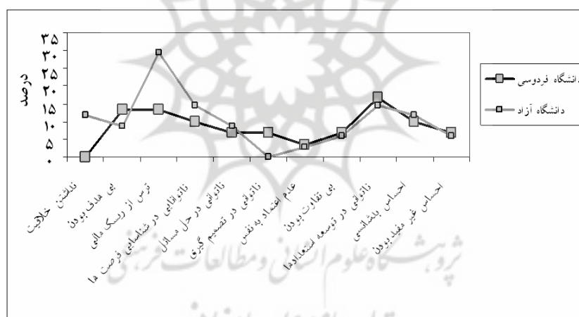
نمودار ۱. موانع اولیه (فردی) در دانشجویان دختر به تفکیک دانشگاه‌های مورد مطالعه

یافته‌های پژوهش نشان می‌دهد ۴۲/۵۵ درصد دانشجویان، ناتوانی در پذیرش خطر مالی را به‌عنوان اصلی‌ترین مانع کارآفرینی تلقی کرده و ۳۸ درصد دانشجویان ابراز داشته‌اند که در توسعه استعدادهای درونی خود ناتوان هستند. همچنین احساس بد شانس بودن، عاملی است که ۳۲/۹۵ درصد دانشجویان آن را یک مانع فردی در راه گسترش رفتار کارآفرینی و موفقیت شغلی خود ذکر کرده‌اند و ۲۹/۵۵ درصد دانشجویان نیز در شناسایی فرصت‌های شغلی مرتبط با رشته تربیت‌بدنی ناتوان هستند. نمودارهای (۱) و (۲) موانع اولیه کارآفرینی دانشجویان دختر و پسر را به تفکیک دانشگاه‌های مورد مطالعه نشان می‌دهند. خاطر نشان می‌شود دانشگاه امام رضا (ع) در رشته تربیت بدنی دانشجوی دختر نمی‌پذیرد.