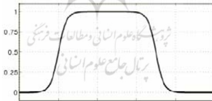
شکل ۲. تابع عضویت تفاوت دو تابع سیگموئید ( a_1=5, c_1=2, a_2=5, c_2=7 )

در حالت کلی هر تابعی که چنین نگاهتی را پیاده کند می تواند تابع عضویت مجموعه فازی مورد استفاده واقع شود. همان طور که اشاره شد، در تابع ورودی در این تحقیق از تابع تفاوت دو تابع سیگموئید استفاده شده است. این تابع در شکل ۲