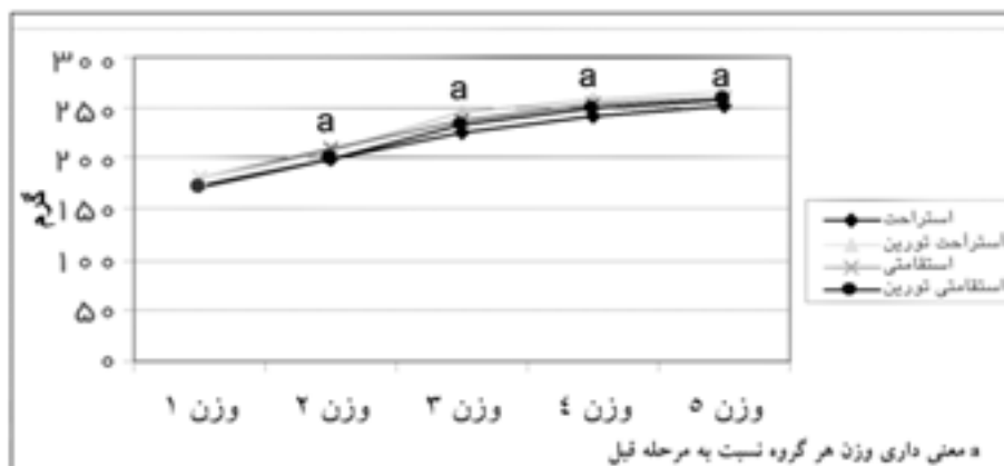
شکل ۱. مراحل وزن کنشی گروه‌های مختلف

اگر چه غلظت تورین پلاسما پس از انجام فعالیت کاهش یافت، این کاهش معنی‌دار نبود. همچنین مصرف مکمل تورین در شرایط استراحت و فعالیت، مقدار تورین پلاسما را به طور معنی‌داری در مقایسه با گروه‌های کنترل افزایش داد (شکل ۲، جدول ۱). مقدار MDA (مالونددید آلدیدید) سرم، شاخص پراکسیداسیون لیپیدی پس از فعالیت در گروه استقامتی بدون تورین در مقایسه با گروه استقامتی تورین به طور معنی‌داری در مقایسه با گروه استقامتی تورین افزایش یافت. مصرف مکمل تورین پاسخ MDA افزایش یافته ناشی از فعالیت را در گروه استقامتی تورین به طور معنی‌داری در مقایسه با گروه استقامتی بدون تورین کاهش داد (شکل ۳، جدول ۲).