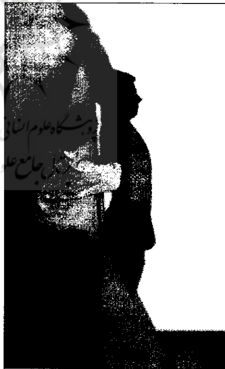
وضعیت استاندارد اندازه‌گیری ROM شانه (۱۰)

اندازه‌گیری دامنه حرکتی مفصل شانه مشکل است، زیرا کمربند شانه ساختاری چند مفصله دارد