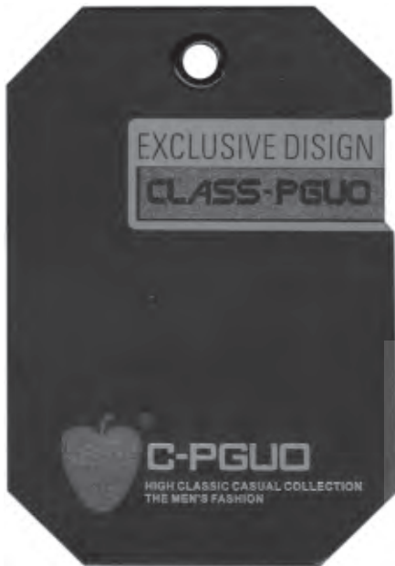
نمونه شماره ۱

شیوه Spot UV براق شده است. نمونه شماره ۳: این نمونه شامل دو تگ است که به وسیله یک نخ به هم متصل شده است