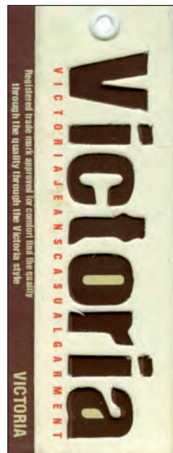
نمونه شماره ۲

مبحث جلوه‌های ویژه را از شماره پیش آغاز کردیم. موضوعی که آموزش‌های بسیاری در درون خود دارد. در این شماره نیز به بررسی جلوه‌های ویژه در نمونه‌های چاپی دیگری می‌پردازیم. همگی ما در طول زندگی با تگ‌های بیشماری سروکار داشته‌ایم. هر وقت لباسی می‌خرید به احتمال زیاد آویزه‌ای به آن وصل است که حاوی اطلاعاتی در مورد لباس مورد نظر، کارخانه تولیدی و موارد دیگر است. از این واقعیت نمی‌توان گذشت که وجود تگ در محصولات تولیدی مختلف علاوه بر اطلاع رسانی‌هایی که انجام می‌دهد بسیار جذاب است و از لحاظ تبلیغاتی حس خوبی را در خریدار برمی‌انگیزد و یکی از عوامل جذب مشتری محسوب می‌گردد. تگ سالهاست که رواج دارد. شاید نخستین حرکت‌هایی که در این زمینه آغاز شد، تگ‌های آویزان به پوشاک بود، اما اکنون گستره استفاده از تگ بسیار فراتر از پوشاک است و حضور این عامل جذاب را بر روی محصولات دیگری نیز شاهد هستید از جمله محصولات بهداشتی آرایشی، مواد غذایی، محصولات صنعتی و ... نخستین تگ‌ها بسیار ساده بود بطوریکه تنها یک نوشته را بر روی یک مقوا شامل می‌شد، این تگ به وسیله یک نخ از سوراخی که بر روی آن تعبیه شده بود به محصول وصل می‌گردید، اما در حال حاضر تنوع