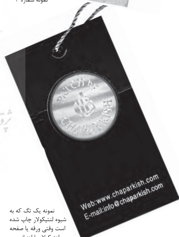
نمونه شماره ۴

نمونه یک تگ که به شیوه لنتیکولار چاپ شده است وقتی ورقه یا صفحه لنتیکولار یا لنز از روی صفحه چاپ شده برداشته می‌شود چیزی مشخص دیده نخواهد شد اما با قرار دادن لنز نوشته ظاهر می‌گردد.