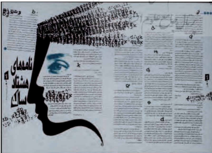
▲ صفحه آرای نشریه در دو رنگ کار کورش پارس‌نژاد

با استفاده از درصد‌های مختلف هر رنگ قادر خواهید بود که تنوعی در طرح ایجاد نمایید. شما می‌توانید از درصد‌های پایین رنگ شروع کرده و تا ۱۰۰٪ که سطحی تنیلات است ادامه دهید. استفاده از سایه روشن‌های هر رنگ نیز چنانچه هوشمندان و درست باشد ضمن ایجاد جلوه‌های رنگی متعدد هماهنگی دلنشین نیز به وجود خواهد آورد. همانطور که در طرح‌های گرافیکی استفاده از فونت‌های مختلف و دارای شکل ظاهری متفاوت زیبایی طرح را خدشه‌دار می‌کند و پیشنهاد می‌شود که در یک طرح گرافیکی اگر هم لزومی به ایجاد اختلاف بین قسمت‌های مختلف متن است با بکارگیری حالت‌های Bold, Italic, ... و یا حتی فونت‌های نزدیک به هم این اختلاف ایجاد گردد در استفاده از رنگ نیز